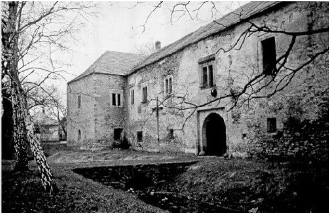
II. Rákóczi Ferenc szülőháza (Internet)

A kuruc világnak Rákóczi volt az éltető magja, fáradhatatlan motorja. Tünneményes alakja ő a magyar történelemnek. Szabadságharca, hagyatéka feltüzeltte, megtermékenyítette a lelkeket, melyekből pompás mesék, mondák, dalok és művészeti alkotások fakadtak. Diadalok öröme, kudarcok bánata, remény és lemondás árad belőlük, az igaz ügyért küzdők iránti rajongó szeretet s a szabadságunkat eltipró ellenség dühös megvetése tör föl századok óta. Riadó kürt és kesergő tárogató dobban meg szívünkben, egy daliás kor gyönyöre és gyászja vibrál idegszálainkon. Rákóczi fejedelem emléke állócsillagként tündököl a Hadak Útján, örök világosságot és példát sugároz minden árva, szenvedő, sötétben botorkáló magyarnak. Csak fel kell emelni csüggedő fejünket, hogy szembenézzünk vele!