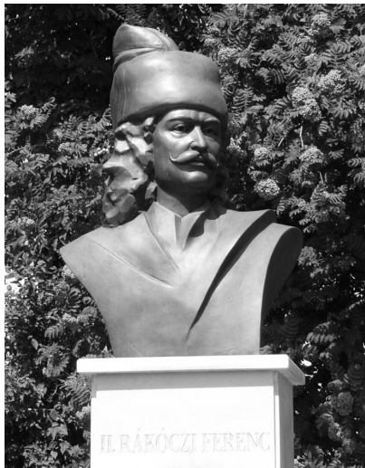
II. Rákóczi Ferenc szobra Miskolc-Görömbölyön (Internet)

Nagy emberek életére visszagondolni mindig hálás feladat, a nemzet óriásaira emlékezni pedig kitüntető megtiszteltetés.