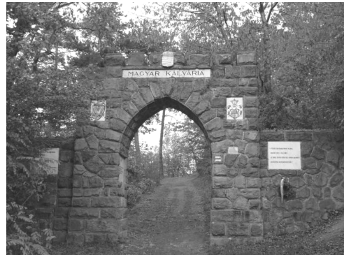
A kálvária bejárata