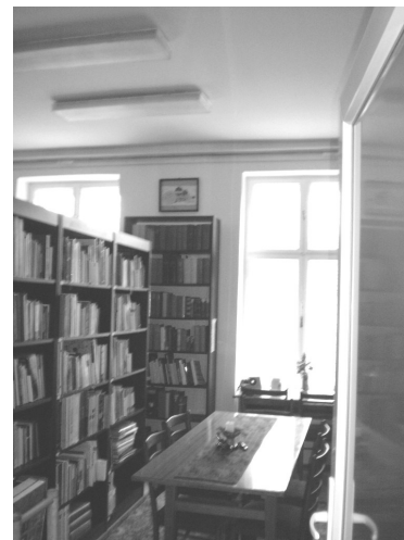
Képek a Miskolci Bölcsész Egyesület Nagy Lajos Király Magánegyetemének felújított oktatási épületéről