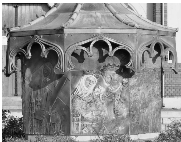
Árpád-házi Szent Erzsébet emlékmű Pesterzsébeten, a Szent Erzsébet templom előtt