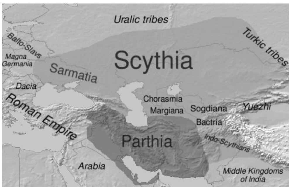
Szkíta és Pártus birodalom Kr. e. 100

Az elmúlt 20 év alatt az arany az Arg néven ismert királyi palota központi bank cellájában volt elrejtve.