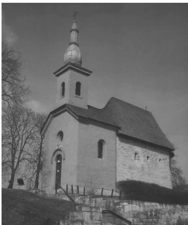
TARNASZENTMÁRIA Római katolikus templom

Nemzeti múltunknak vannak századai, melyekből egyetlen írott sort sem tudunk felmutatni, de nagyszerű élő emlékek maradtak fenn. Gondolok itt számos műemlékünkre, melyek őseinknek az igen magas műveltségéről tanúskodnak. A régé-