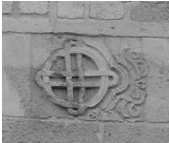
Fonatos kereszt

vetségjele volt. De hogy kabar eredetű, miszerint a koronázási ékszereink közül a jogaron is ez a nyomat látható. Nem csak Csemegi József tanulmánya, hanem más szakkutatás is az Aba-nemzetséggel, s annak kabar eredetével hozza összefüggésbe.