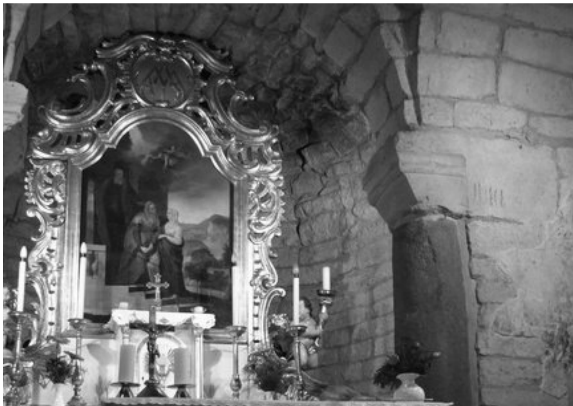
TARNASZENTMÁRIA Római katolikus templom szentély (Internet)

(Látomások helyén épültek kápolnák, templomok!)