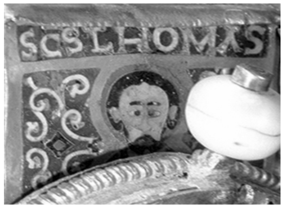
Indák/agancsok között négyzöggel