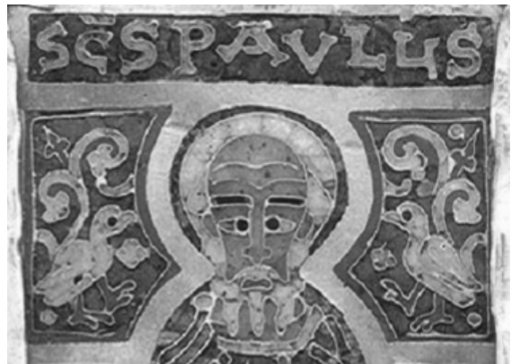
Madarak indákkal és az ár jelével