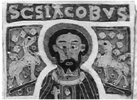
Oroszlánok leveles kereszttel