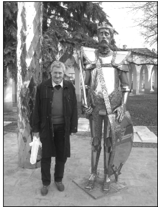
Vitézek találkozója (egy páncélos lovagkirály és jómagam)