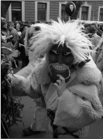
Egy vidám arc a sokaságból