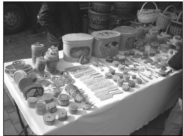
Míves munkák fából és fakéregből