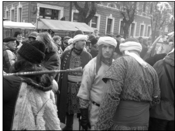
Az állítólag elkergetett törökök békésen masíroznak