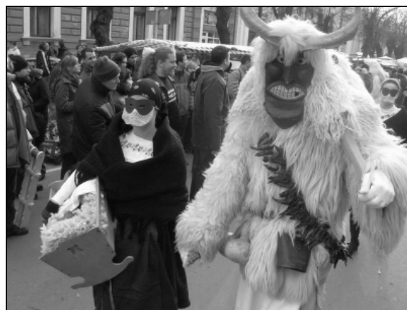
Gondolni kell a busó útanpótlásra is