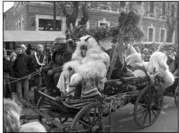
Lovas kocsin az új tavasz felé