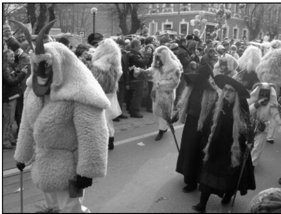
Vonulnak a busók a főutcán (+két boszorkány)