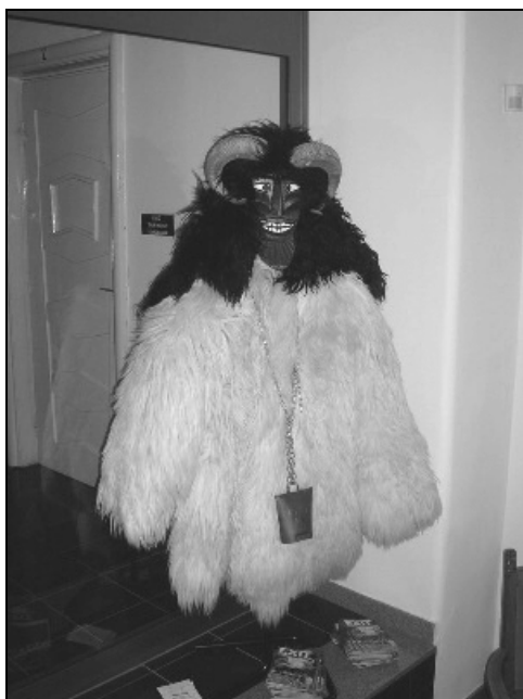
A mohácsi Városházán kiállított maszk