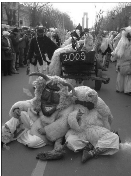
„Sztrájkoló” busók az út közepén