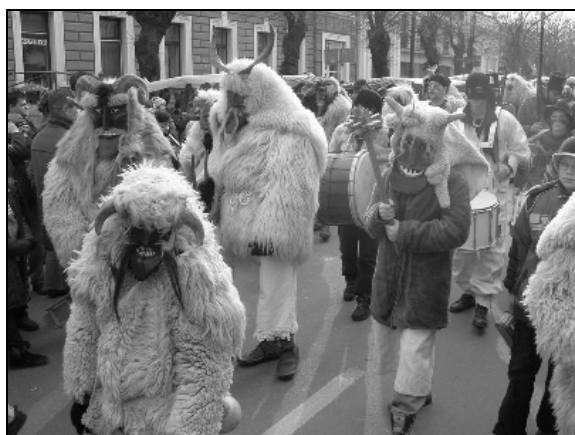
Síppal, dobbal, kereplővel űzik el a telet