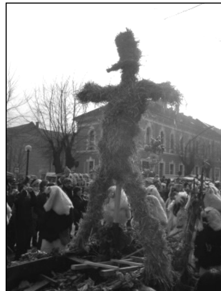
„Délceg” szalmabábu a tűzre vetés előtt