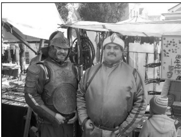
Árusok stílszerű öltözetben