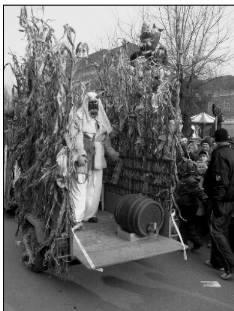
A busók is gyakran megszemjárnak