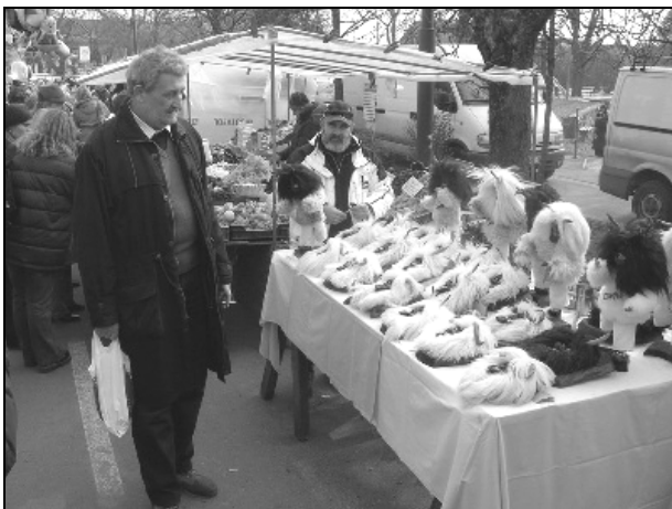
Álarcok mustrája a busó bazárban (Siklói András)