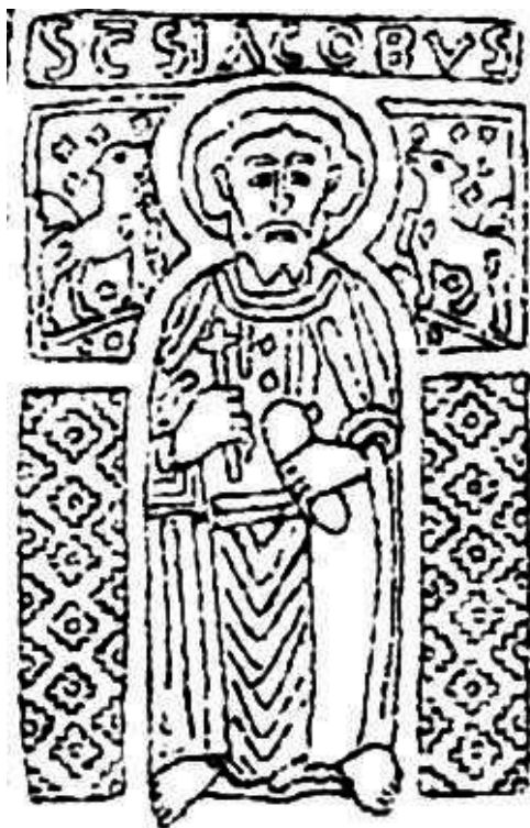
6. a) ábra