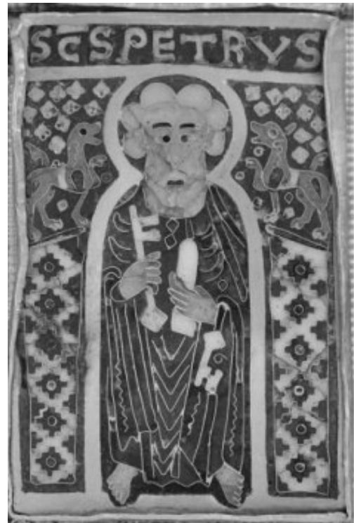
5. b) ábra