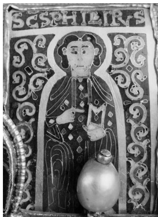
3. b) ábra