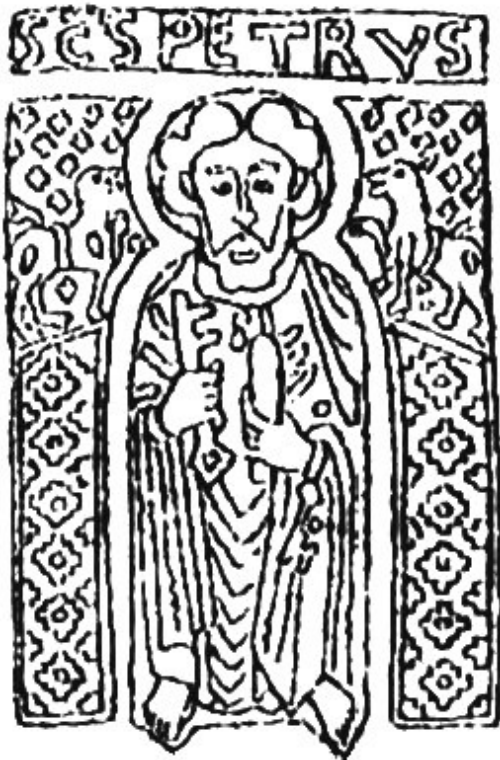
5. a) ábra