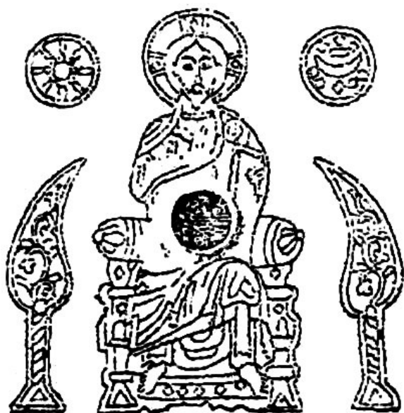
9. a) ábra