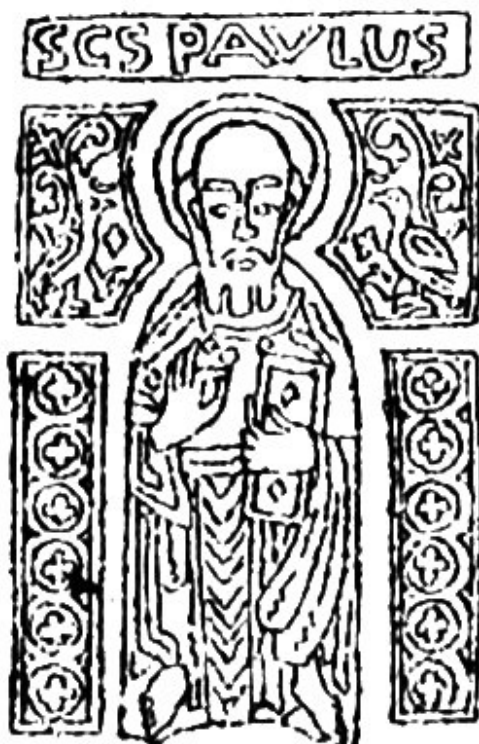
2. a) ábra