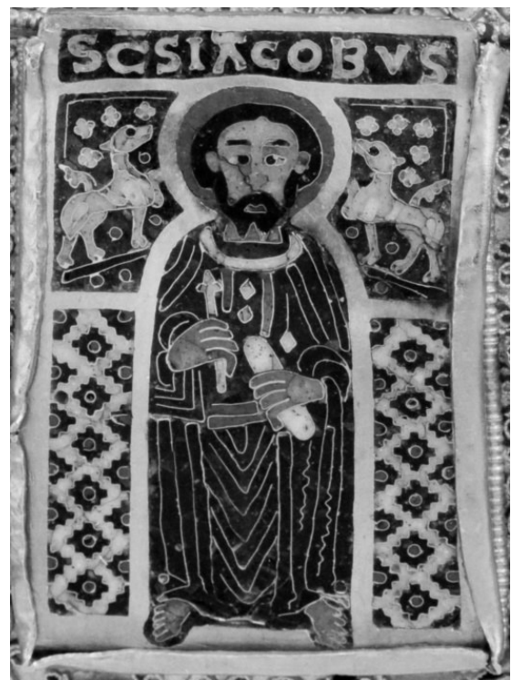
6. b) ábra