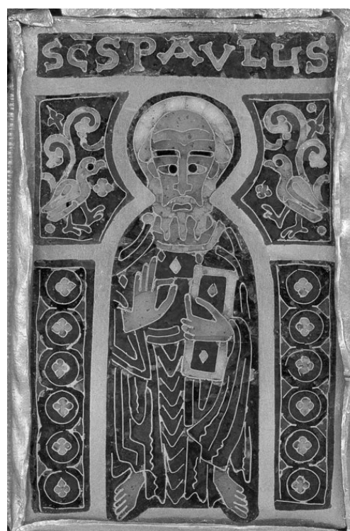
2. b) ábra