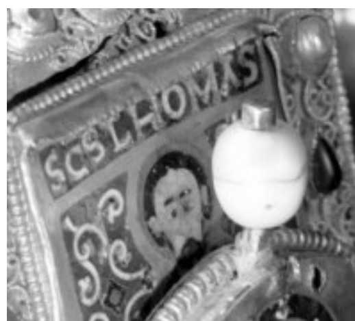
4. b) ábra