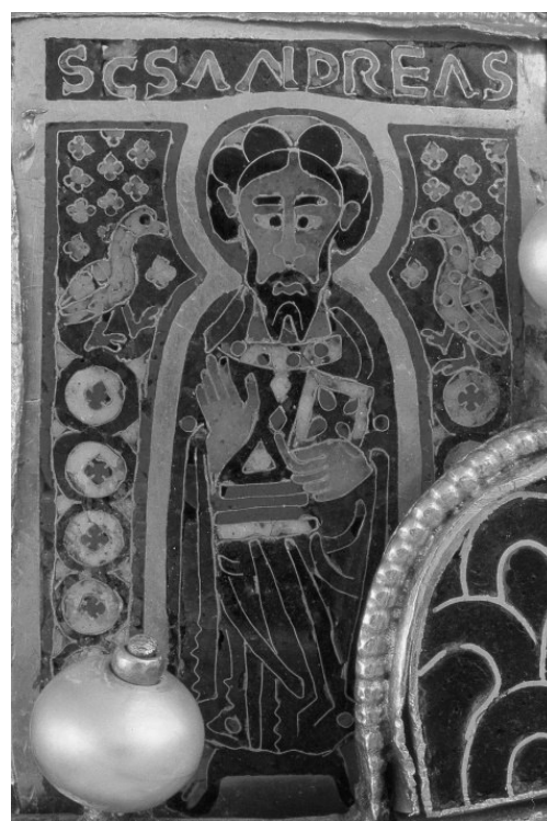
7. b) ábra