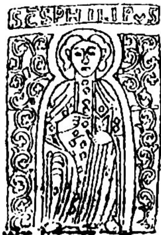
3. a) ábra