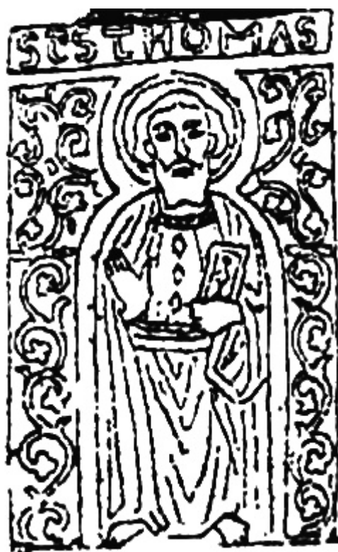
4. a) ábra