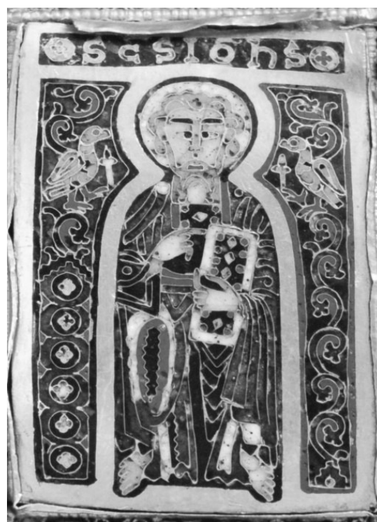
1. b) ábra