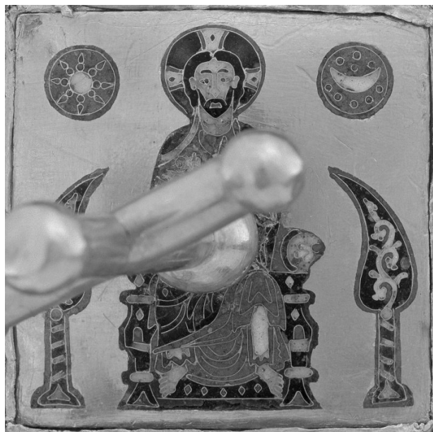
9. b) ábra