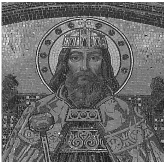
Balatonalmádiban a Szent Jobb kápolnában Róth Miksa által készített Szent Istvánt ábrázoló aranymozaik részlet