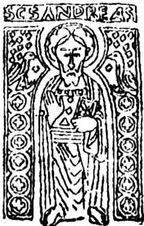
7. a) ábra