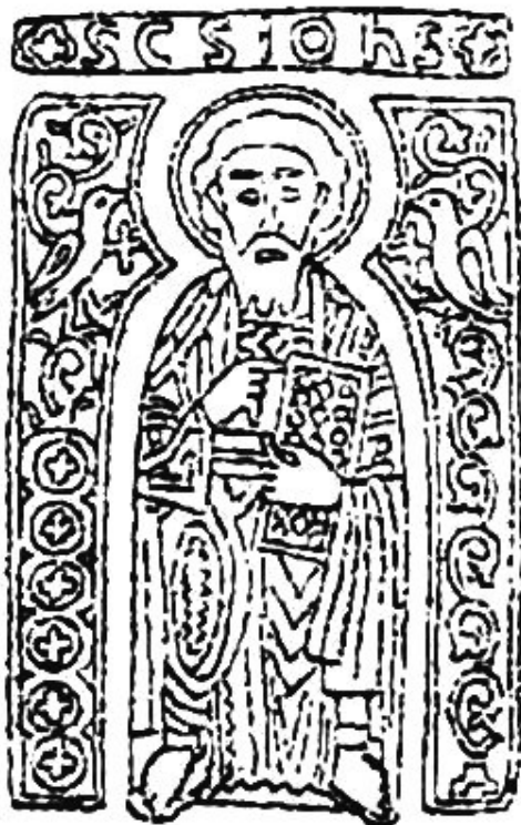
1. a) ábra

Bal oldalon az 5. ábráról nagyított képek, jobbra Szelényi Károly fotóművész felvételei fekete fehér változatban