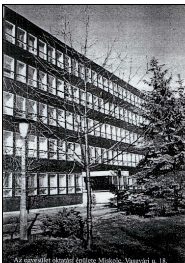
Az egyesület oktatási épülete Miskolc, Vasevári u. 18.

Hampó József magyar táncait, botos tánc, süvegtánc Aranyosi György trombitaművész adta elő, nagy sikerrel, a szerző kísérte zongorán.