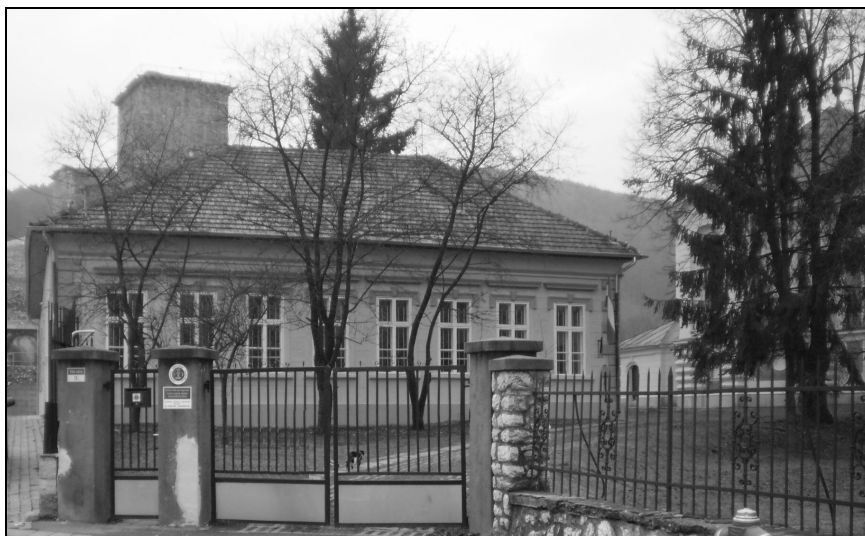
A régi és új iskolánk