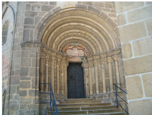
Képek a Szent István rotundáról

Az Attila szoborcsoport méltó emléket állít az egykori Hun Birodalom főkirályának Tullnban. A germán népek, a hunok egykori szövetségesei példamutatón magásra tették a mércét, hogy miként kell tisztelni az ősök emlékét. Hazánkban ma mindössze Sopronban, Tápiószentmártonban és Pilisszántón a Csillagösvényen áll Attila szobor. Talán ideje lenne, hogy mi a hunok utódai is megemlékezzünk ősi nagy királyunkról és a magyar kegyelet is megalkossa a maga emlékművét. Tudatosítva a világgal, hogy itt egykoron igen is egy nagy birodalom Hunnia virágzott, és mi magyarok ily módon a Kárpát-medence jogos örökösei vagyunk.