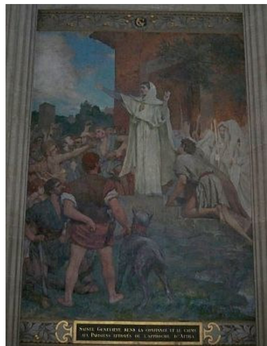
Szent Genovétát ábrázoló freskó a Pantheonban