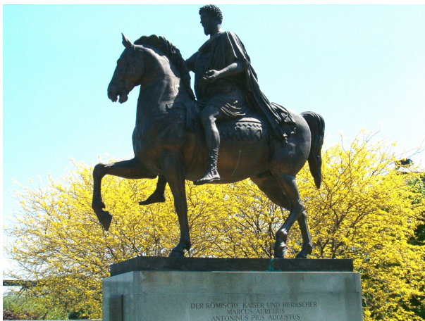
Marcus Aurelius lovas szobra

Aqvincumba. A rómaiak jelentősen kiépítették és megerősítették a várost. Ma is sok római emlék található itt. Az egyik patkó alakú római korú védőbástya ma is eredeti állapotában látható közel a Dunához. Itt található a Római múzeum is. A tárlókban gazdag régészeti anyag tanulmányozható. Előtte a Duna gáton, közel az Attila szobor kompozícióhoz áll Marcus Aurelius monumentális lovas szobra. A szobor pontos mása a Rómában álló eredeti alkotásnak. Marcus Aurelius több évig állomásozott a markomman háborúk idején a városban. Tulln nem messze van Carnuntumtól, amely egykoron Pannónia, illetve Pannónia Superior fővárosa volt. Carnuntum a legújabb kutatások szerint azonos az egykori Sicambriával, illetve Etzelburggal Attila fővárosával. 1 Itt volt egy igen fontos átkelő a Dunán, amiről tudósítanak az ősi krónikák is. „Midőn Attila hadai itt keltek át a Dunán, majd az ausztriai Tulna városa felé vonultak, ami három pihenőnyire van Bécestől.” A krónikás azt is hozzá teszi, hogy Tulna városát ekkor még a latinok lakták.