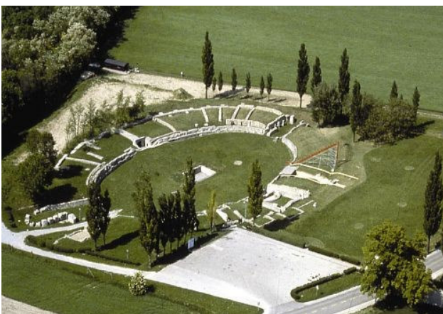
Bad-Deutsch-Altenburg anfitéátrum (Internet)

Sárga zsinór a zöld tájban, sárga táblák a zöld mezőbe ékelődve, eljött a hazatérés ideje, mai utunk véget ért, az ének elhalkult, a lejtő levezet a magasból, a gondolataim még fenn lebegnek, zsidbadt fáradtság kerít hatalmába. Az utunk ismét hasznos volt.