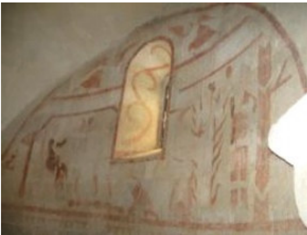
Körkápolna déli falán található freskórészlet

Számomra igazából az ablak két oldalán található futó angyalok öltözéke volt érdekes, hiszen piros szoknyájuk alól kilátszik a fehér nadrág, mely takarja lábaikat. Nagyon sietnek a kapott hír továbbításával. Nem tudtam megfejteni az ablak két oldalán található, egymással szembe forduló fekete koronák jelentését. A kérdésekbe burkolt gondolatok megmaradtak, megfejtésük még várat magára. A templomban átéltem a hangok, a zümmögés, az ének rezgésének lélekmelegítő érintését. Ez a tiszta, gyógyító hang a csoda, amit minden körtemplom magában hordoz.