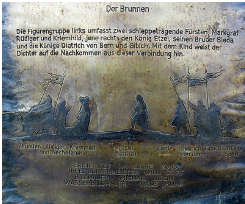
Részletek a szoborcsoportról