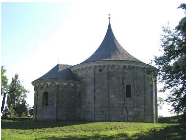
Keresztelő Szent János Körkápolna

Ez a hely, jelentéktelensége ellenére nagyon fontos üzenetet hordoz, hiszen egy keresztelő kápolna és bejárata fölött egy nagyon ősi kép jelzi a templom rendeltetését. Ezt a szentséget erősíti a mellette álló ház kéményén fészkelő gólya pár is. Nem értem, hogy egy ősi beavatási, szentelési helyet, hogy lehet temetkezési hellyé alakítani?