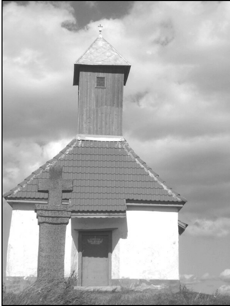
Bogáti kápolna kereszttel

Nagyon előnyös hely, jó a kilátás a két Csíki-medencére, ezt őseink szeme is észrevette. E helyen egykor erődítmény, vár állott, ennek alaprakata még látszik, 220 lépés kerülettel bír. A Bogát hegyen most kápolna áll 1725-ben épült és Szent Fülöp és Jakab tiszteletére szentelték fel.