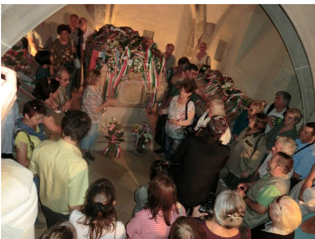
A XVI. Magyar Őskutatási Fórum résztvevői II. Rákóczi Ferenc és sorstársai síremlékei előtt a Kassai Dóm altemplomában