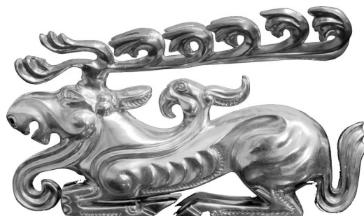
Tárgyak a kiállítás anyagából