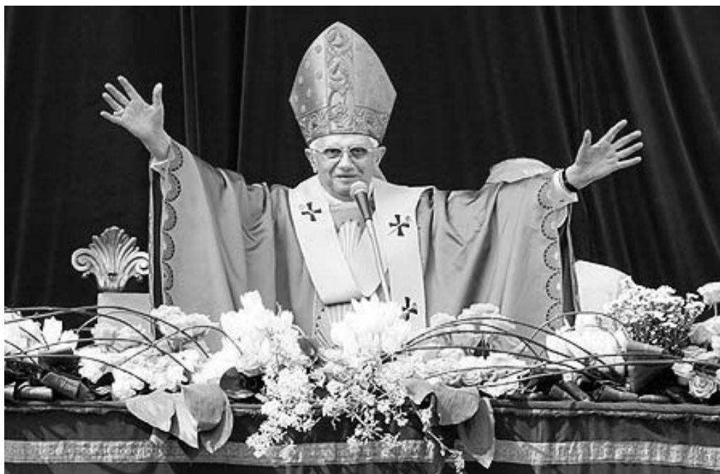
XVI. Benedek pápa