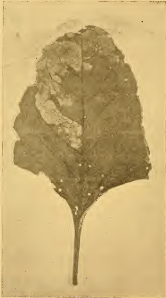
3. A répalégy nyűvének rágása nagy levélben. — Kisebbitett kép. —

míg a répatáblán répa van és a míg meleg napok járnak. Persze nem egyszerre rajzik, hanem akként fejlődik, hogy mindig akad tojás is, nyű is, báb is, de légy is. Némely bábból nyáron nem kel ki a várt 8. – 10. napon a légy, hanem a báb olykor heteken