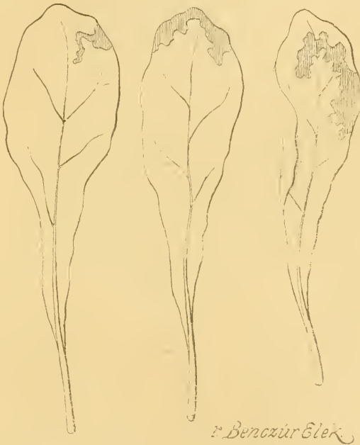
2. A répalégy nyüvének rágása a fiatal répalevéiben.

A megnőtt lárva legtöbbször elhagyja a hólyagos levelet és sekélyen földbe, kissé a felszíne alá furakodik. Itt 6—7 mm. nagyságú, hosszúkás tojás-alakú, vörhenyes bábbá alakul át. Későbbben színe sötét-barna lesz. Némely nyű, kiváltképen a nyári, nem hagyja el a hólyagos levelet, hanem benne bábozódik