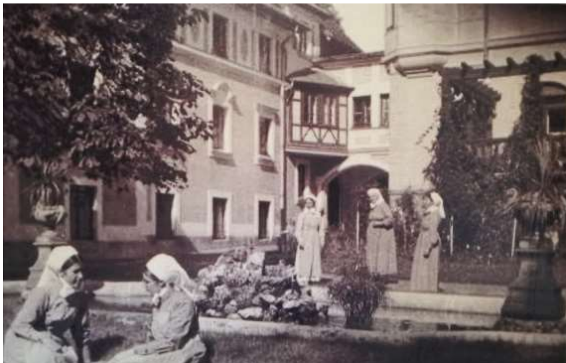
Diakonissza testvérek a Villa kertjében 1929-ben Bodoky család tulajdonában lévő kép

Erős kapcsolódás alakult ki a két intézmény között, hiszen a Bethesda kórháznak szüksége volt a diakonisszák magas szintű munkájára melyben az ápolást művelték, a Diakonissza Anyaháznak pedig a testvérek egészségügyi képzésében volt szüksége a kórház támogatására. 1906-ban állt be a Filadelfia Diakonissza Szövetség első válsága, mikor a Német Leányegyház meg akart válni a Bethesdától, amit a Magyarországi Református Egyház javára ajánlott fel. A Református Egyháznak kapóra jött volna a kórház, hiszen egyházuk megalakulása óta számos zsinati rendelet siettetett egy református egyház és diakonisszaház alapítását. Ámde, sajnos a pénz hiányára hivatkozva a felső vezetés elutasította a Bethesda Kórház megvételét. Ebből adódott, hogy aztán miniszteri utasítással a diakonisszák kiemelkedő munkájának eredményeképpen, és megbecsüléseképpen 1907-ben nyilvános közkórházzá kiáltották ki a Bethesda Kórházat. 11