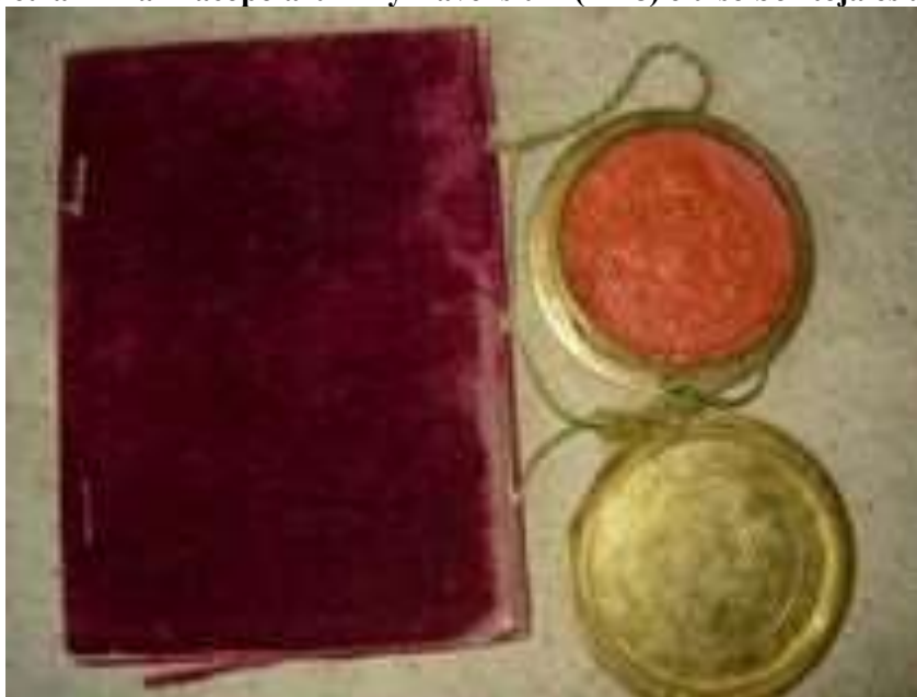
1. ábra Articulari Pharmacopolarum Tyrnavensium (1748) elülső borítója és a császári pecsét