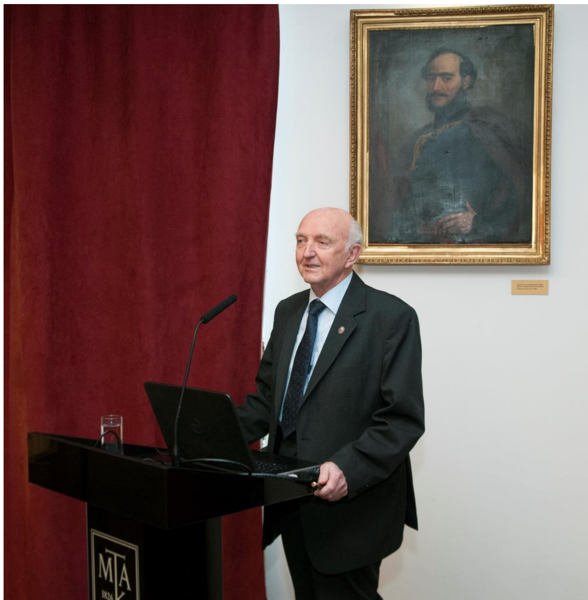
Kroó Norbert fizikus, az MTA tagja az Akadémikus Arcképcsarnok nyitóelőadásán

Időpont: 2016. december 8., 16:00 óra, Konferenciaterem, résztvevők száma: 37 fő