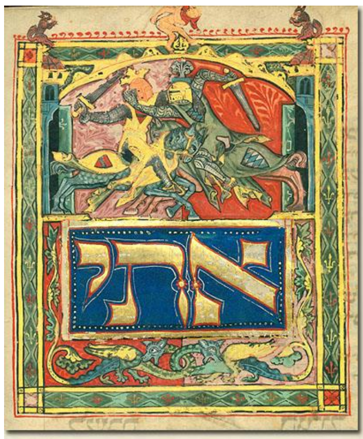
Részlet az Ulmer Museum – Glaubensfragen. Chatrooms auf dem Weg in die Neuzeit. c. kiállítására kölcsönzött, a Kaufmann-gyűjtemény részét képező Háromosztatú Mahzór-ból (Keleti Gyűjtemény)

A Bélyegmúzeum számára az Asztro-trilógia című kiállításához (2016. december 8.–2017. március 20.) 1 db ősnymtatványt és 1 db antikvát kölcsönöztünk.