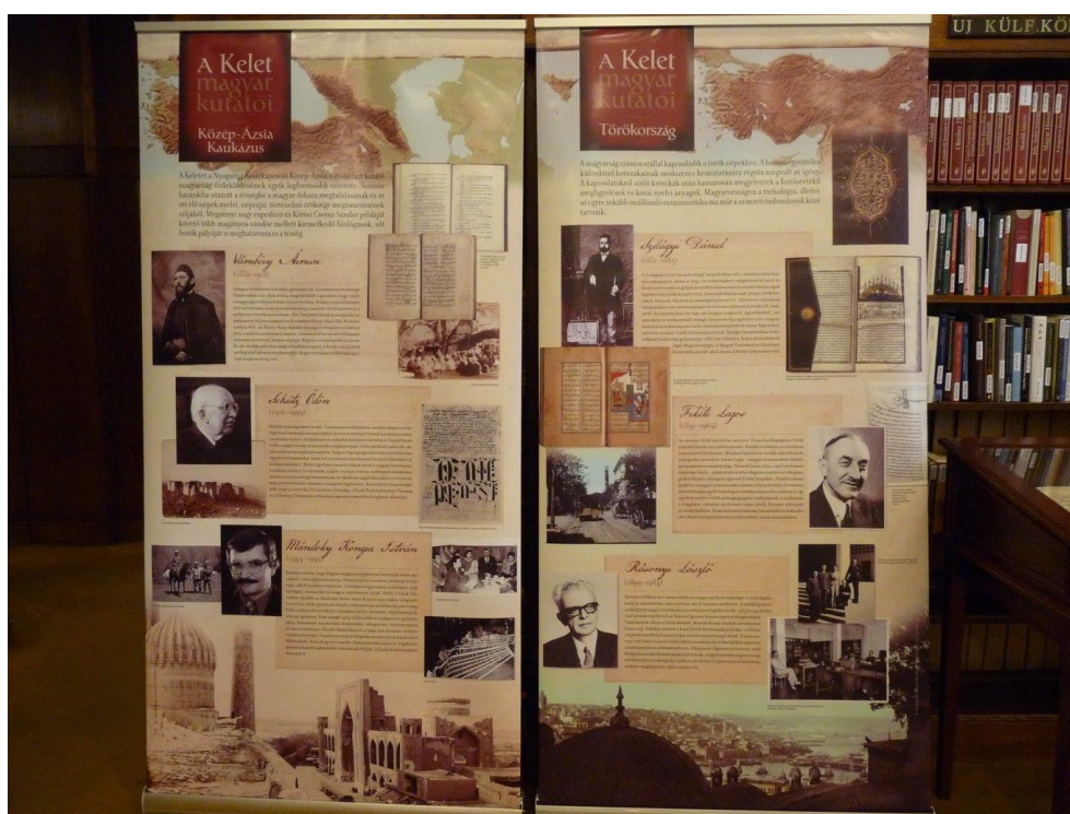
A Kelet magyar kutatói kiállítás részlete a Múzeumok Éjszakáján