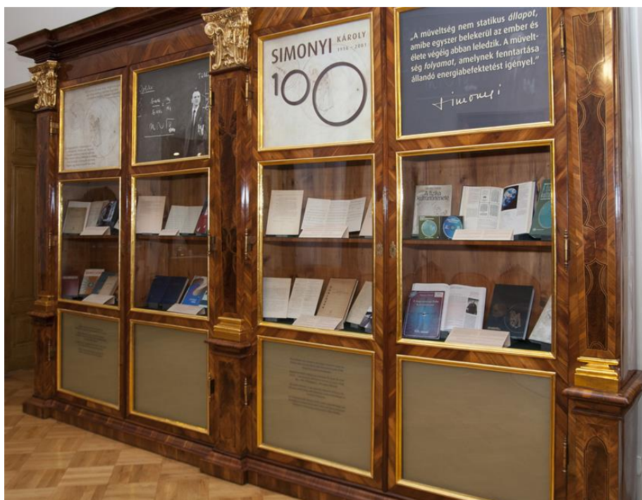
A Simonyi100 kiállítás az MTA Tudós Kávézójában

A Keleti Gyűjtemény és az Indira Gandhi National Centre for the Arts közös rendezésében A Kelet bővületében (kurátor Kelecsényi Ágnes) címmel 2015. március 24-én Új-Delhiben bemutatott Stein Aurél kiállítást 2016 folyamán több indiai helyszínen ismét láthatta a nagyközönség, így Kolkata, Darjeeling, Lucknow egyetemén, illetve állami múzeumában is. A Kelet magyar kutatói című utazó kiállítást, amelyet a Keleti Gyűjtemény szintén 2015-ben állított össze a Külgazdasági és Külügyminisztérium megbízásából, 2016-ban az alábbi helyeken mutatták be: Kairó, Nairobi, Stockholm, Banja Luka, Szarajevó, Brüsszel, Baku, Canberra, Jakarta, Kuvait, Szabadka. A kínai nyelvre is lefordított kiállítást Sanghajban szintén bemutatták. Az Indiáról szóló tablót külön is kiállították az Asiatic Society Kőrösi Csoma emlékszobájában, Kolkatában. A Kelet magyar kutatói című kiállítást az MTA Könyvtár és Információs Központban is megtekinthették az érdeklődők 2016. június 25-én, a Múzeumok Éjszakája rendezvénysorozat keretében.