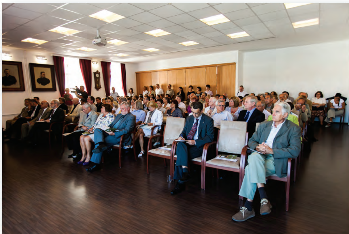
Áz MTMT TÁMOP nyitórendezvényének közönsége