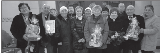
A Őszi Napfény Nyugdíjas Egyesület tagjai és a kerek évfordulós ünnepelő házaspárok

Az Őszi Napfény Nyugdíjas Egyesület tagjaival – december 12-én - Nagykállóból Nyíregyházára indultunk. A Magyarok Nagyasszonya Társszékesegyház gyönyörű falai között tartott karácsonyi ünnepségen, és a kerek évfordulós házaspárok köszöntésén vettünk részt.