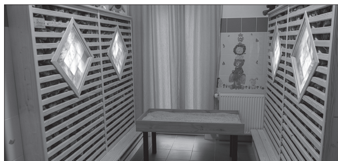
Az újonnan elkészült szósoba

Ha megemlítem meg azt, ami számunkra a legnagyobb eredményt, sikert jelent, nem csak a tavalyi évben, hanem egész munkánk során. Ez nem más, mint megélni, tapasztalni a gyerekek folyamatos fejlődését, látni a mosolyt az arcukon, és tudni azt, hogy biztonságban érzik magukat nálunk, mi pedig válaszként megtapasztalhatjuk, hogy milyen érzés általuk szeretve lenni. Ezért is hálásan köszönjük a szülőknek a bölcsődebe vetett bizalmukat!