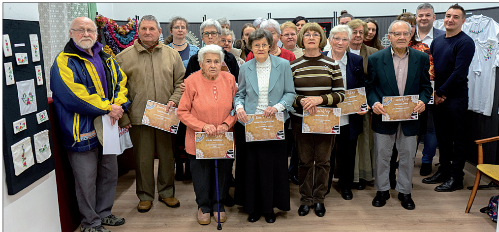
Nagykállói kincsek készítői

-Szegényebbek lennénk nélkülük, hiszen mindannyian tovább viszik a zene, a tánc, a kézműves és a történelmi hagyományainkat, őrzik értékeinket – tette hozzá az ünnepség szónoka, majd így folytatta: - Tegyük fel, mi lenne velünk a magyar kultúra ezeréves alakítói nélkül? A Comeniusok, Károli Gáspárok, Tompa Mihályok, Kassai Lajosok, Kazinczy Ferencek, Balassi Bá-