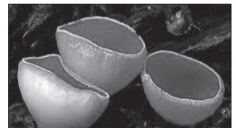
A látványos piros csészegomba mérgező