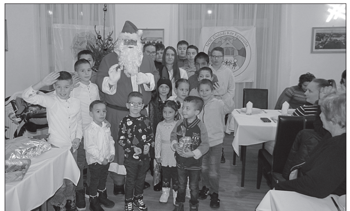
Nagy öröm volt találkozni a Mikulással

A Mikulás okozta izgalmak feldolgozása a rendelt sültes tálak és a tagok által készített és hozott sütemények elfogyasztása közben került sor. Közben jócskán fogyott a tombola szelvény is. A vacsora után, a karácsonyfa mellett átadásra kerültek azok az élelmiszer-csomagok, amelyeket a Nagycsaládosok Országos Egyesülete (NOE) révén Termelők a Nagycsaládokért programban kapott egyesületünk. Szintén a NOE jóvoltából részesülhettek tagjaink a HENKEL adományaiból is. Minden jelenlévő családunk kapott csomagot, melyben