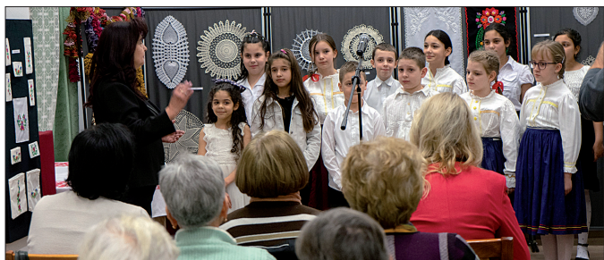
A Nagykállói Általános Iskola énekkara és néptáncsoportja nagy sikert aratott

„Nélkülük nincs haza sem, nincs föld, kisebbre nő a fa, a búza megnyomorodik, és megnyomorodik a lélek, hegyek válnak gerinctelenné, nélkülük megfolyik a kő, kiönt, madarak torkáig árad, öleléseink elszáradnak, elvadul a szó is a szájától, mert nélkülük nincs haza, nincs föld, nép, anyanyelv, ...”