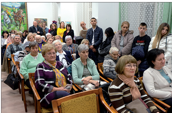
A magyar kultúra napját ünneplő közönség

nemzeti tudatunk erősítésének, hogy bemutassuk és tovább adjuk a múltunkat idéző tárgyi és szellemi értékeinket. Az ezen a napon megnyílt XIII. Nagykovács kincsei című kiállítás kapcsán pedig elmondta, hogy már belátható közelségben van, amikor elkészül az a rendezvényközpont, amely méltó helyszíne lesz egy-egy kulturális eseménynek, programoknak Nagykovácsban.