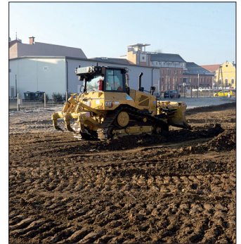
A majdani kulturális központ helyszínét készítik elő