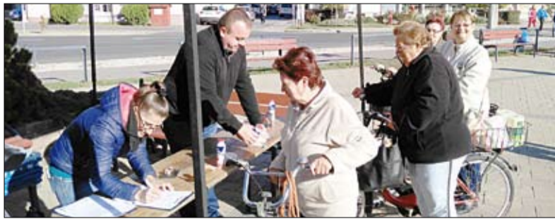
Jutalmazták a környezettudatosan, két keréken érkezőket

Az EFOP-1.5.3-16-2017-00041 azonosítószámú „Humán szolgáltatások fejlesztése Nagykállóban és térségében” című pályázat keretében a vállalkozó szellemű kerékpárosok egy négy napos programsorozaton vehettek részt, melynek során különböző helyszíneken bicikli tartozékokat gyűjthettek be. Október másodikán csengőt, majd október 5-én egy finom reggelit kaptak, október első hétfőjén, szombaton lámpát, vasárnap pedig prizmat vihettek haza a két keréken érkezők. Fialatok, idősek, családok és baráti társaságok egyaránt részt vettek a rendezvényen. A programsorozat cél-