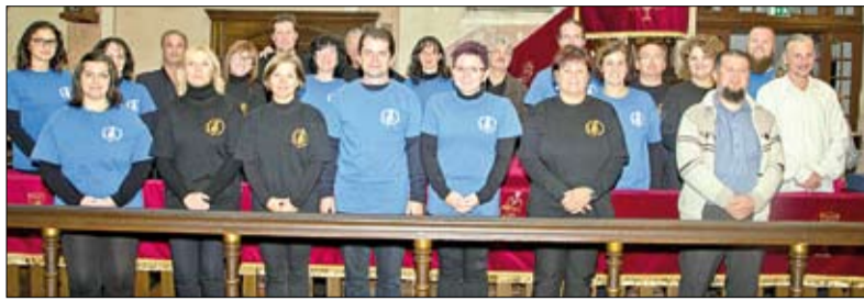
A Meglepetés Énekegyüttes egykori és jelenlegi tagjai

Megalakulásának 15. évfordulóját ünneplő Meglepetés Énekegyüttes adott hangversenyt szeptember 29-én a zene világnapja és az idősek világnapja alkalmából a Nagykállói Református Műemléktemplomban.