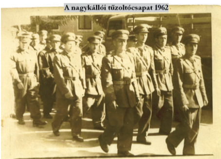
A nagykállói tűzoltócsapat 1962

2007-ben újabb gyökeres változás következik be, melynek révén az egyesület személyi állománya jelentősen átalakult. A bázist azóta a TESZOVÁL vállalat dolgozói jelentik. A technikai fejlődést pedig az szolgálja, hogy 2007. szeptember 18-án a német testvérváros