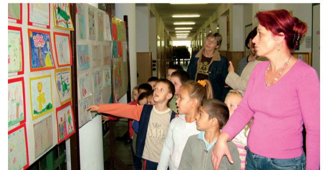
Az óvosok a könyvtárban

A 6-14 évesek meseíró pályáza ton vehettek részt, amelyet Benedek Elek születésének közelgő 150. évfordulója alkalmából hirdettek. Kedves, humoros és igen színvonalas, fantázia dús mesékkal – 55 db – jelentkeztek a „jövő meseírói”.