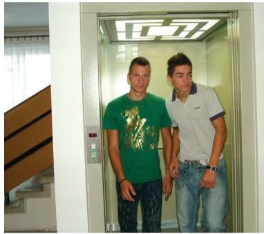
Elkészült a lift is

Ez év tavaszán az Új Magyarország Fejlesztési Terv Észak-alföldi Regionális Operatív Program Európai Unió által társfinanszírozott pályázatán – 10 százalék saját forrás biztosítása mellett – 24.985.800 forintot nyert Nagyálló Város Önkormányzata a Szakközépiskola épületének komplex akadálymentesítésére.