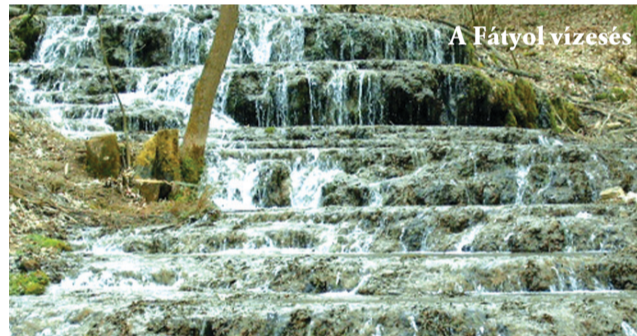
A Fátyol vízesés

A nagykállói Szabadidősport és Természetbarát Egyesület (SZATE) 2008. október 24-ére (péntekre) kirándulást és túrát szervez a Bükk-hegységbe, a természetkedvelők, a gyalogolni vágyók, az érdeklődők, az egyesület tagjai és barátaik részére.