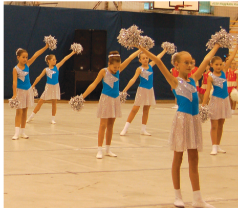
A „Ficánká” bemutatója

Meneteltek indulókra, pom-ponoztak vidám zenékre, forgatták a botot, a zászlót. Érdekes koreográfiákat csodálhatott meg a közönség, s a szigorú zsűrinek is volt munkája.