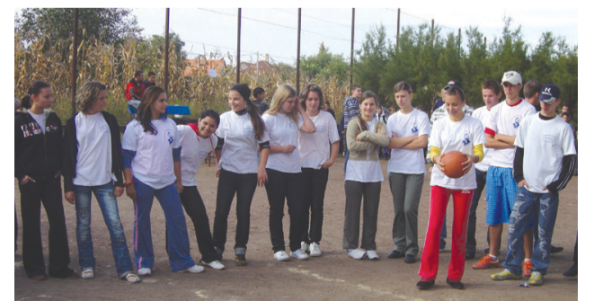
A résztvevők egy jókedvű csoportja

területeit, s annak összetettségét. A legügyesebb diákok értékes nyereményekkel térhettek haza.