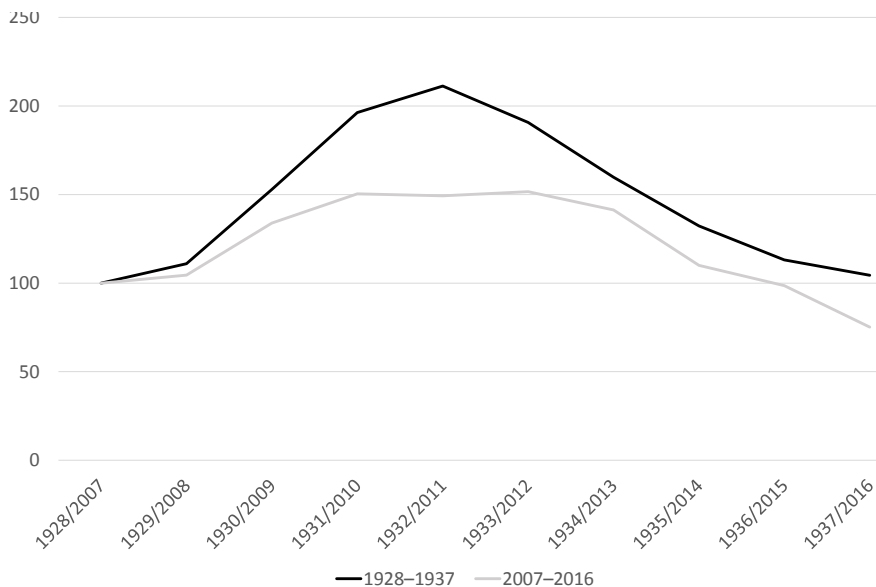
1. ábra: A munkanélküliek számának bázisindexei két válságidőszakban Number of unemployed people in two crisis periods (base year=100)