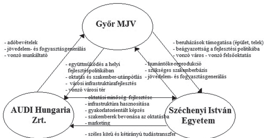
2. ábra: Az egyetem, a gazdaság és a város együttműködésének győri modellje The Győr-model based on the relationship between university, industry and government