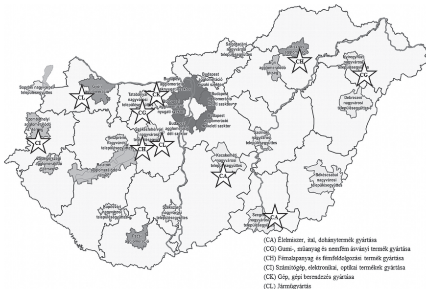
2. ábra: Háromcsillagos potenciális feldolgozóipari klaszterek a városrégiókban Three stars potential manufacturing clusters in the city regions

Elkülönülnek azok a várostérségek, ahol a járműgyártáshoz potenciálisan kapcsolódó feldolgozóipari tevékenységek folynak. Ezekben a térségekben olyan termelésintenzív iparágak vannak, mint a gépi berendezések gyártása (CK), amelyek lokalizációs előnyökből profitálnak, szoros kapcsolatban állnak az ügyfelekkel, és amelyekben a vállalati méret jellemzően kicsi, az innováció forrását gyakran a továbbfelhasználói (pl. járműipari) kapcsolatok jelentik.