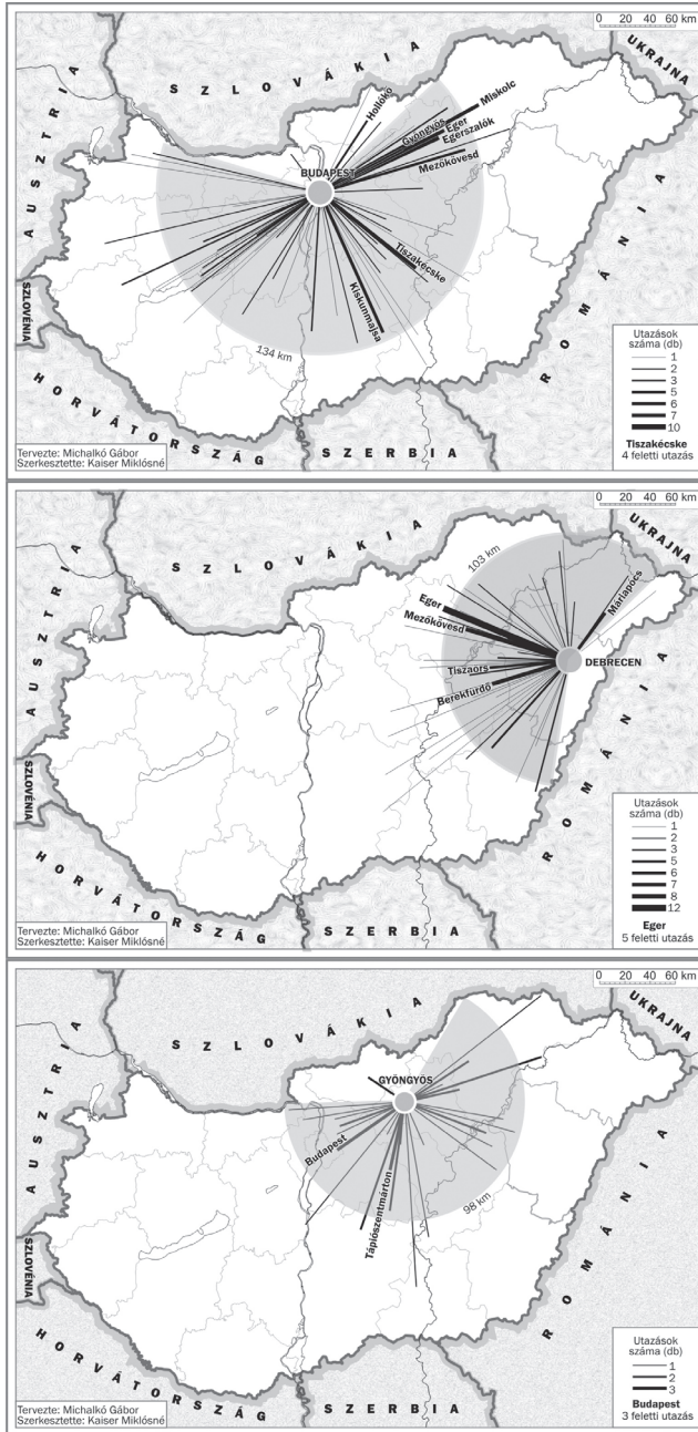
3. ábra: A belföldre irányuló termékbemutató utak célterületei Budapestról, Debrecenből és Gyöngyösről Domestic destinations of sales show trips originating from Budapest, Debrecen and Gyöngyös