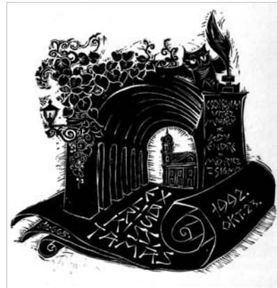
Az ex libris Vitéz Ferenc Protestáns könyvjegyek című monográfiájából való.