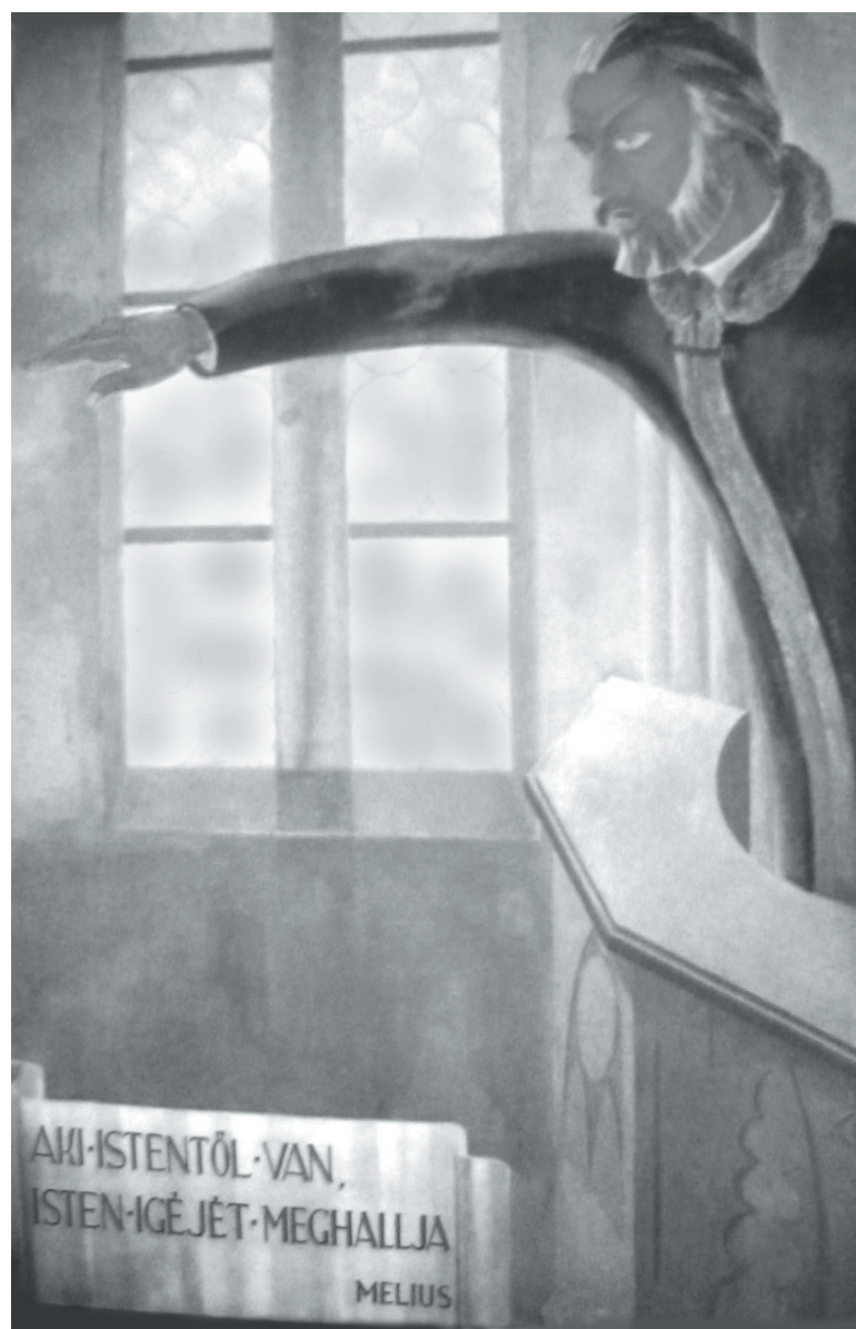
Méliusz Juhász Péter