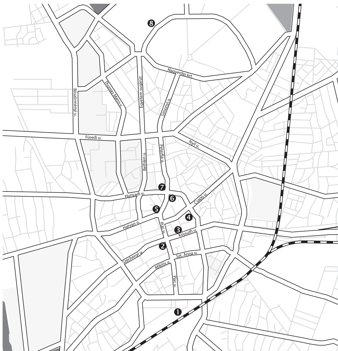
A város térképe