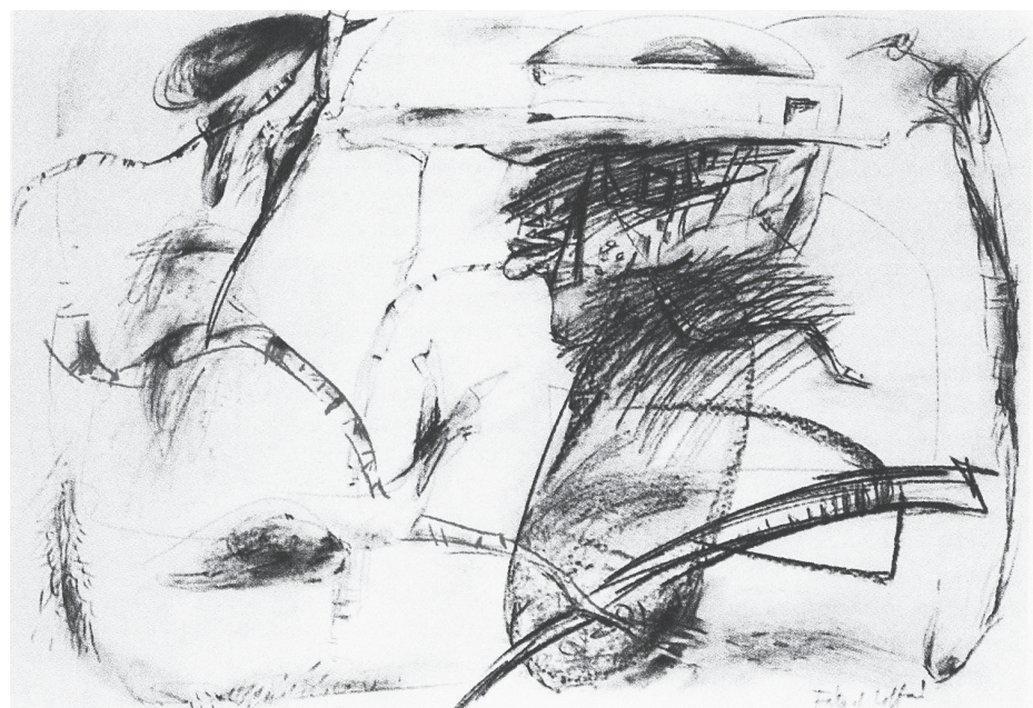
Fátyol Zoltán: Átmetszett profil