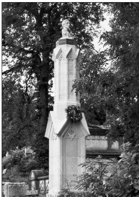
A síremlék egy mai felvételén