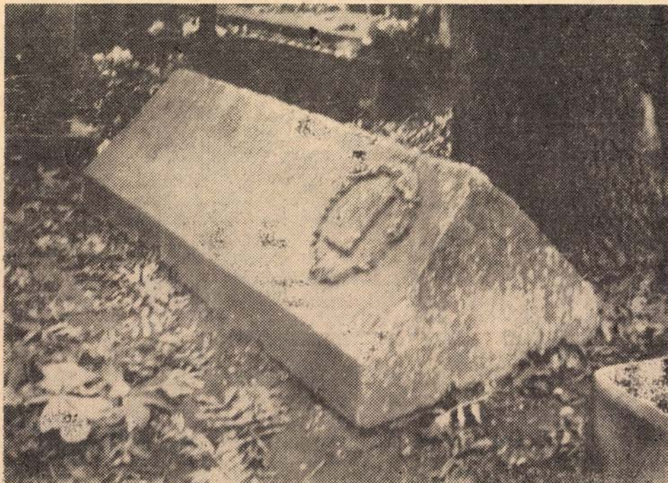
A kolozsvári házsongárdi temetőben ma található legrégebb unitárius emlék: Szentábrahám L. Mihály püspök koporsó alakú sírköve 1758-ból

Hossza alul 220 cm. Felül 200 cm. Magassága a fedél pereméig 3 cm. Szé- lessége 61 cm (I.m. 297.).