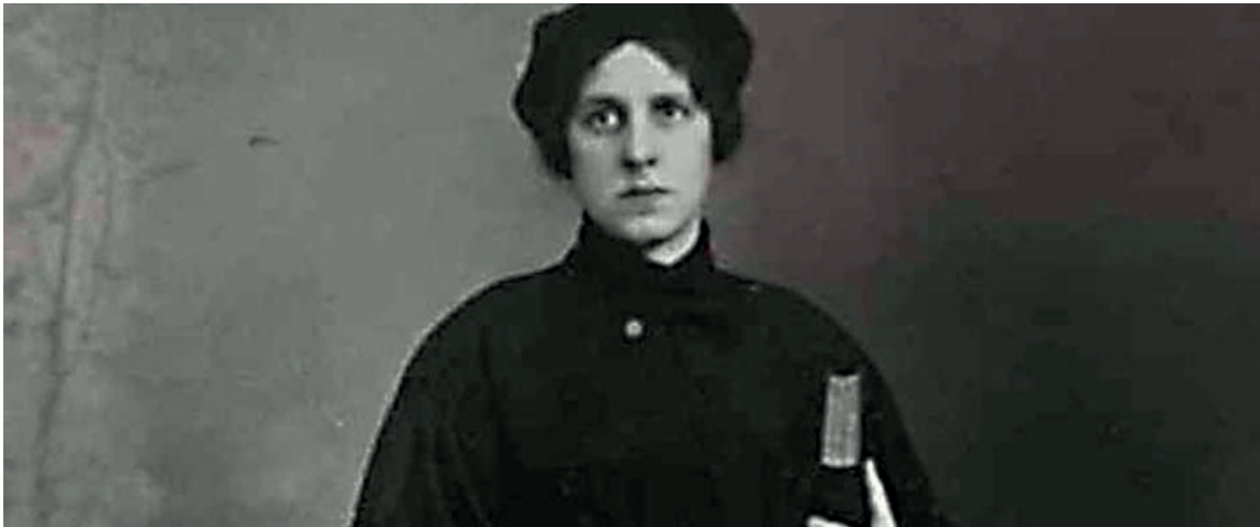
Regina Jonas rabbi

Rási azt találta ki róla, hogy minden tudása ellenére könnyelmű volt, és nem tudott ellenállni férje egyik bocher-tanítványa fiatalos varázsának, majd szégyenében öngyilkos lett. Rási saját állítását akarta ezzel a mesével igazolni, mely szerint a nőt könnyű elcsábítani ( Kiddusin 70b). 71 Pletykálgodott Bruria kárára, ami azért nem nevezhető egy tisztességes eljárásnak!