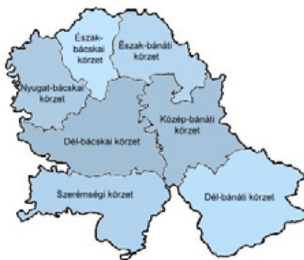
Vajdaság 7 körzete (2. ábra)

A terület felosztható hét körzetre a közigazgatás tekintetében, ezek Észak-Bácska, Dél-Bácska, Észak-Bánát, Közép-Bánát, Dél-Bánát és Szerémség. Ezen belül 6 várost (Szabadka, Zombor, Nagybecskerek, Pancsova, Újvidék és Mitrovica) és 45 községet különböztetünk meg, melyek összesen 467 települést jelentenek. Infrastruktúra-ellátottsággal egyedül Újvidék rendelkezik, míg Szabadka és Nagybecskerek nem teljes, bár még mindig elfogadható szinten mozog, a kisebb településeken viszont csak a legszükségesebbek vannak jelen.