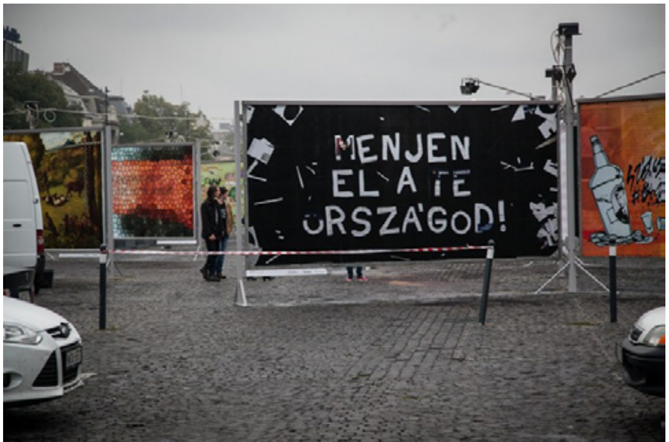
ARC plakátkiállítás, 2015.

http://hvg.hu/itthon/20150716_Ime_az_első_sikeruzenet_a_kormány_új_plak