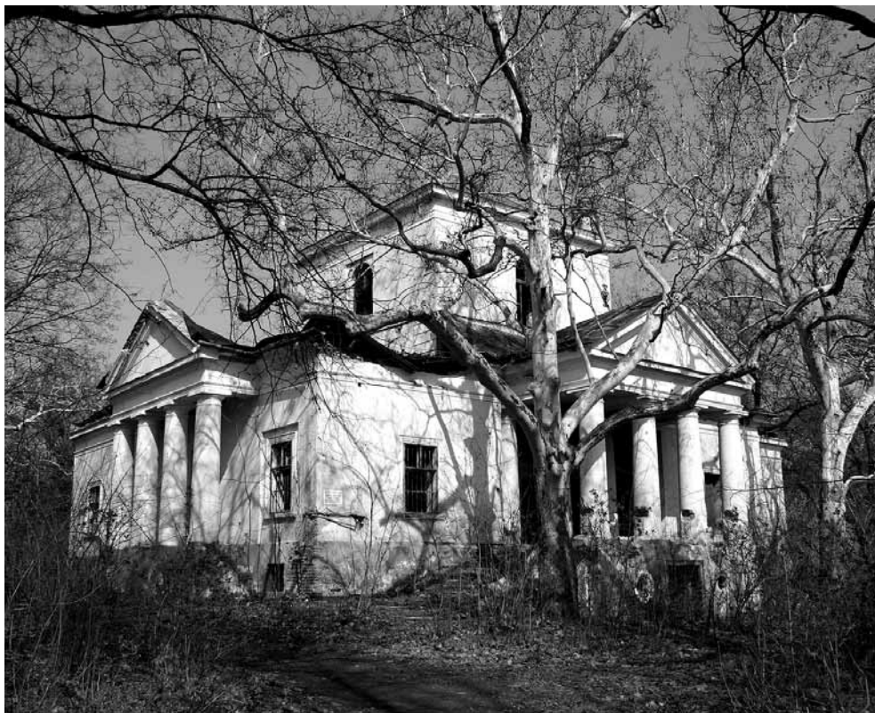
Lökösháza – Bréda-major, a palladiánus Vásárhelyi-kastély

Nem feledkezhetünk meg arról sem, hogy Magyarország