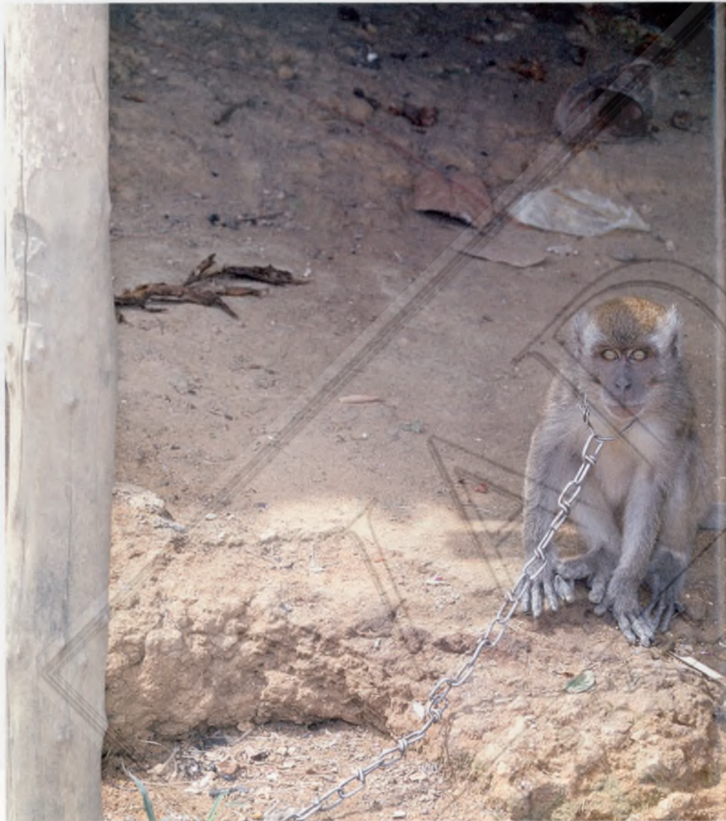
A szegény, láncravert majom feladata a házörzés az öserdei jahai tanyán