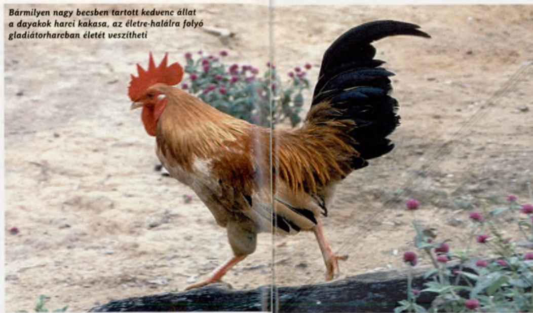
Bármilyen nagy becsben tartott kedvenc állat a dayakok harci kakasa, az életre-halálra folyó gladiátorharcban életét veszítheti