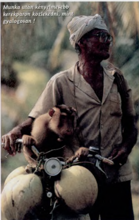
Munka után kényelmesebb kerékpáron közlekedni, mint gyalogosan!