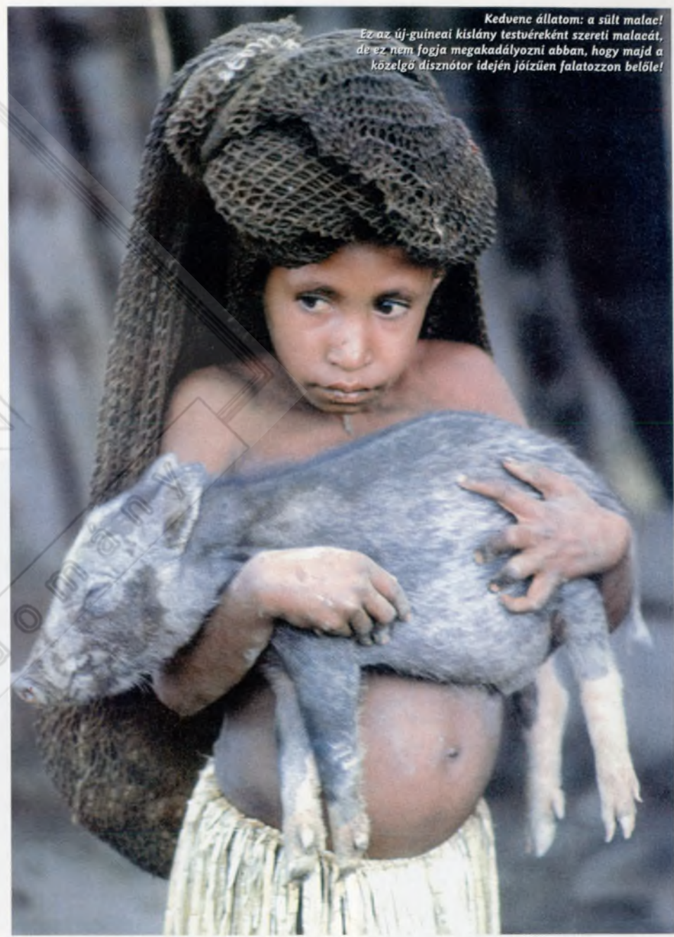
Kedvenc állatom: a sült malac! Ez az új-guineai kislány testvéreként szereti malacát, de ez nem fogja megakadályozni abban, hogy majd a közelgő disznótör idején jóízűen falatozzon belőle!

leszármazott ( Canis lupus dingo ), mely sok évezredek vándorútja során követte az embert Ázsiából Ausztráliába. Vadásztárs és hálótársa lett az embernek, szinte jószántából. Eleinte nyilván csak a nomád bennszülöttek hátrahagyott ételmaradékain, le- húsolt csontokon élt, s mintegy sereghajtóként követte az embereket. Később egy-egy jobb falat reményében egyre közelebb merészkedett a tűzhöz, míg végül