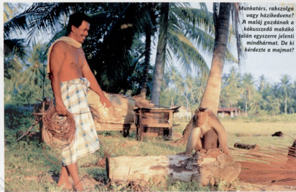
Munkatárs, rabszolga vagy házikedvenc? A maláj gazdának a kókuszszedő makákó talán egyszerre jelenti mindhármát. De ki kérdezte a majmot?