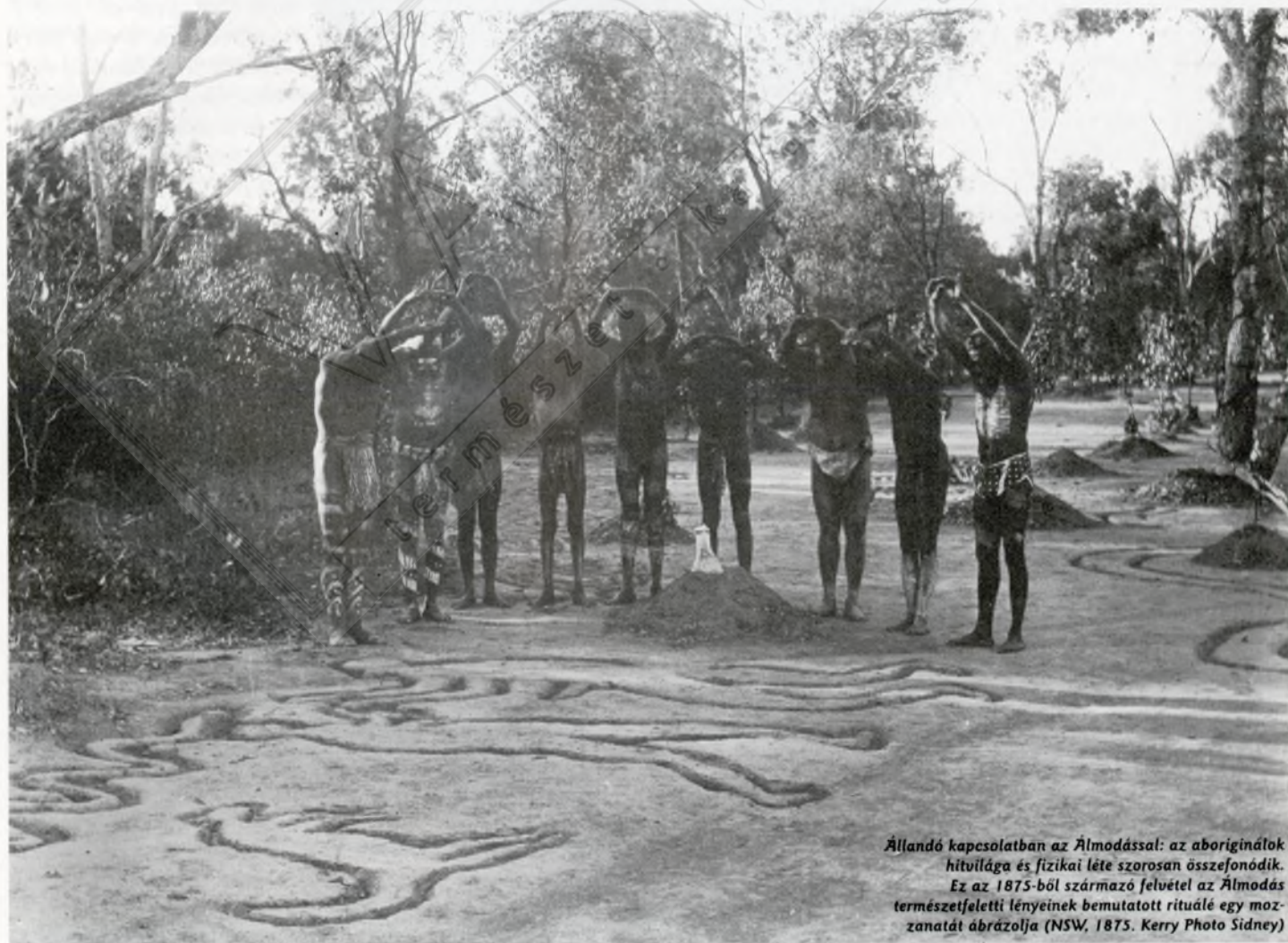
Állandó kapcsolatban az Álmodással: az aboriginálok hitvilága és fizikai léte szorosan összefonódik. Ez az 1875-ből származó felvétel az Álmodás természetfeletti lényeinek bemutatott rituálé egy mozzanatát ábrázolja (NSW, 1875.)

Az igazság azonban nem is lehetne távolabb ettől a tévhiedelemtől. A valóság lényege a mi kultúránk és az övék között fennálló felfogásbeli különbségben rejlik. Az úgynevezett „fejlettebb” társadalmak alapja a materiális javak (terület, élelem, jószág stb.) megszerzésén, gyarapításán, biztosításán nyugszik. Tulajdonképpen erre támaszkodik és ezeket a célokat szolgálja a társadalomformáló vallások, politikai irányzatok és a filozófiák nagy része. Ez a mi világszemléletünk, én-tudatunk táptalaja, bármennyire is szeretnénk mindezt valahogyan szebbnek, nemesebbnek, erkölcsileg elfogadhatóbbnak feltüntetni.