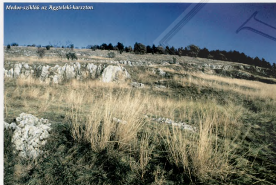
Medve-sziklák az Aggteleki-karszton

nyílt meg a turisták előtt a Rákóczi-barlang, és a Béke-barlang is újra fogadja a látogatókat. A gazdag felszín alatti vizes élőhelynek számító barlangrendszereken és a bennük élő közel 500 állatfajon kívül természetesen a felszíni ökológiai, botanikai, zoológiai és néprajzi értékek is említést érdemelnek. A jósvafői falutúra és az egész nyáron át tartó kulturális eseménysorozat nem számít újdonságnak, de az Európai Nemzeti Parkok Napja alkalmából a közeli társintézményekkel közösen szervezett programokon idén vehet részt először a természetbarát nagyközönség. Szintén ke-