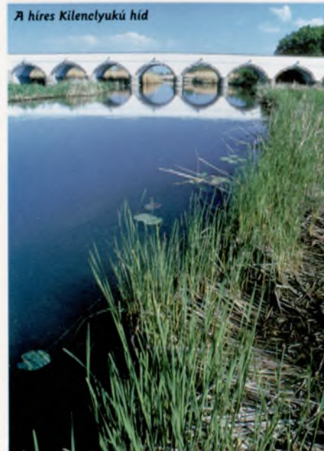
A híres Kilenyukú híd