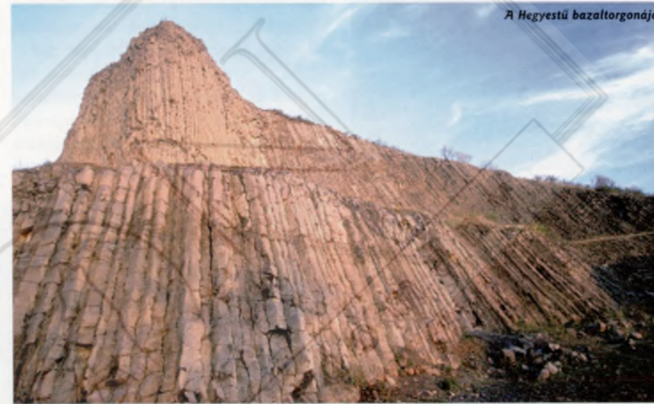
A Hegyes-tű bazaltorgonája

Szintén a közelmúltban készült el két tanösvény. A Szent György-hegyi hét állomáson mutatja be a környék növényzeti, állattani, földrajzi érdekességeit. A 4 km hosszú ösvényen egy-egy táblát a bazaltorgonáknak, a kis álljégbárányoknak és a hegyről nyíló csodálatos panorámának is szent-