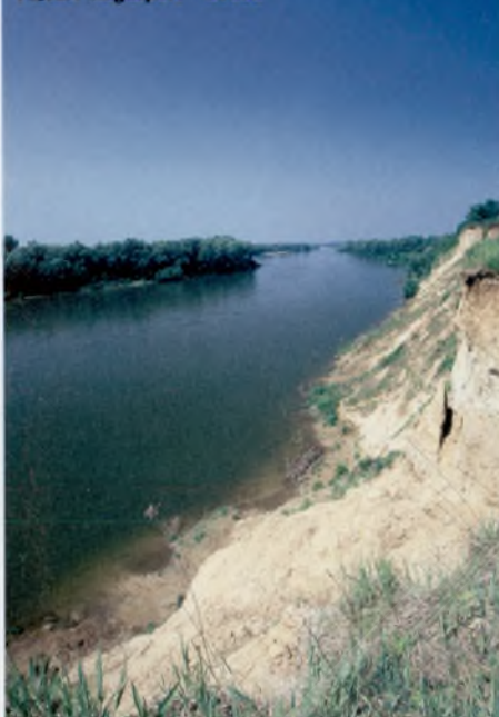
Vízvári magaspart – Dráva

élőhely megzavarása nélkül. A torony az új tanösvény egyik állomásaként látogatható meg. Szintén újdonság a Dráva mellett, Matty térségében kialakított másik tanösvény, amely Keselyősfapuszta közelében a Kormorános-erdő és a Boros-Dráva természeti értékeit mutatja be a látogatóknak. Felújítás után újra érdemes végigsétálni a Mecsekben a Vár-völgyi tanösvényen. Ami a tanösvények egyre gyarapodó rendszerét illeti, meg kell említeni az átadás előtt álló szársomlyói és az Újmohács közelében kialakítás alatt álló útvonalakat is.