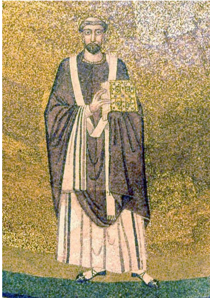
Papst Symmachus (498–514) Apsismosaik, Mitte des 7. Jahrhunderts Basilika Santa Agnese fuori le mura, Rom

Die Bibel. Einheitsübersetzung der Heiligen Schrift. Stuttgart, Katholische Bibelanstalt GmbH, 1980.