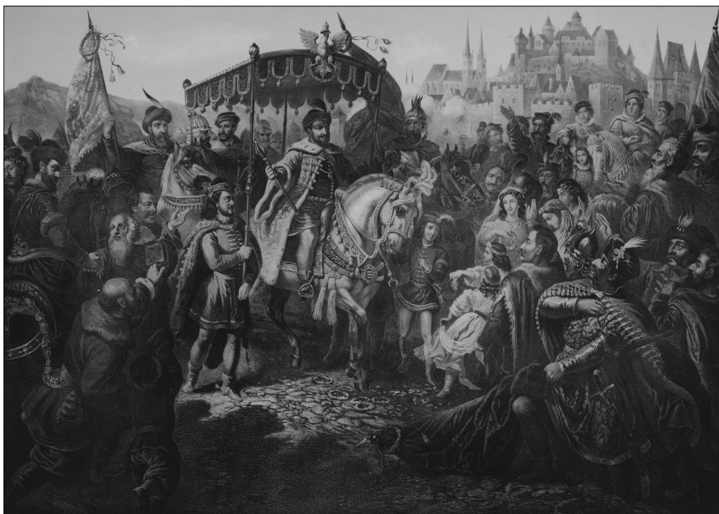
Vízkelety Béla – Franz Kollarz: Báthori István fejedelem fogadtatása Krakkóba 1576-ban. 1859. Kőrajz. A Napkelet 1859. II. félévi műlapja. MNM TKCS, ltsz.: 7553

Bocskai Papp Lajos februárban megjelent történeti elbeszélése pedig a jelenet konkrét irodalmi és történelmi forrásait is világossá tette: Vízkelety kompozícióján megelevenedő fényes ünnepség voltaképp a török időkben a nemzeti függetlenség hordozójának tekintett Erdély virágkorának utolsó, tragikus fejezetéhez kötődik. 52 A bál házigazdája a jobb szélén ülő, a töröknek meghódoló, gyenge kezű erdélyi fejedelem, Apafi Mihály, szemközt vele hitvese, Bornemisza Anna társalog egy külföldi követtel. Az előtérben Bánfi Dénes vezeti táncos párját, Béli Pálnét. Őket figyel a szélről Aranka férje, Béli Pál és a fejedelem tanácsosa, Teleki Mihály. Béli Pálné szépségétől megigézett Bánfi Dénes közben megcsókolja az asszonyt. Meggondolatlanságával saját halálos ítéletét írja alá. A féltékeny Béli Pál hamarosan beleegyezését adja vetélytársává lett barátja kivégzéséhez, amit a török porta parancsára Teleki Mihály és Csáki László közreműködésével hajtanak végre. Bánfi Dénes, az erdélyi seregek fővezérének meggyilkolása Erdély függetlenségének megszűnésének nyitánya volt. Az ötvenes években aktuális felhangokkal bíró, de a romantikus szerelmi szálát sem nélkülöző politikai parabola népszerű tárgya volt a korszak történeti elbeszéléseinek. Cserei Mihály, a 17. századi krónikás nyomán Jókai 1851-ben az Erdély aranykorában elevenítette fel a tragikus történetet, majd hatására Szigligeti Ede szomorújátékként állítja színpadra Bánfi és Béli történetét (Béli Pál, 1856).