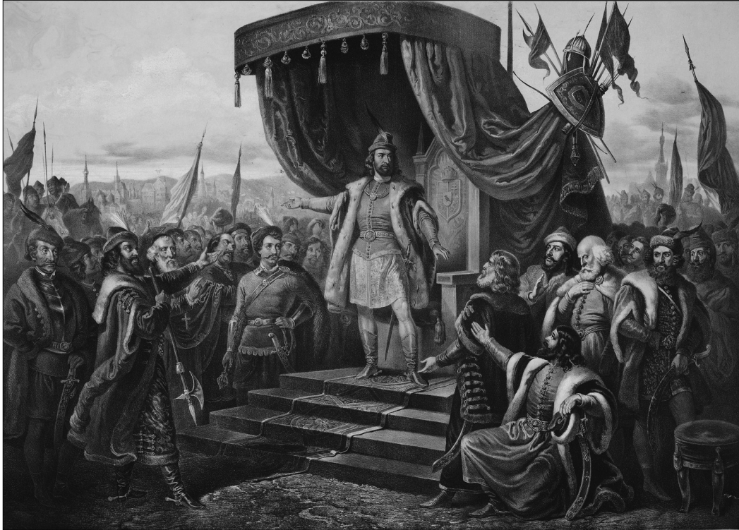
Vizkelety Béla – Franz Kollarz: Mátyás, az igazságos, 1858. Napkelet 1858. II. félévi műlapja. MNM TKCS ltsz.: 7640

műbíró egyáltalában nem nélkülözhet. 34 Rámutatott arra is, hogy a viselettörténet a történeti festészet mellett a színházművészet, valamint a nemzeti jelleg kidolgozásán munkálkodó kortárs divattervezők számára is fontos forrás lehet.