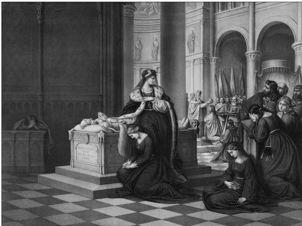
Vizkelety Béla – Marastoni József: Erzsébet és Mária királynők Nagy Lajos sírjánál, 1865. Kőrajz. A Pesti Hölgy-divatlap 1865. I. félévi műlapja MNM TKCS, 1808

nagyban hozzájárultak a téma 19. századi gazdag utóéletéhez. A koronázási jelenetet Túróczy nyomában Horváth Mihály Magyarország története is leírta. 147 Mária és Erzsébet hányatott sorsa irodalmunkban különösen a forradalom utáni időkben került középpontba. Jókai 1854-ben megjelent népszerű feldolgozása, A magyar nemzet története, a szemtanú Lorenzo de Monaci krónikája és Bonfini nyomán külön fejezetben beszéli el Mária királynő történetét. 148 1856-ban három drámai mű is feldolgozta a témát, 1857-ben pedig Jósika Miklós Két királynő című színdarabja került bemutatásra. Vizkelety Béla számos korábbi történeti kompozíciójának megrendelője, Vahot Imre, már korábban is foglalkozott a tragikus sorsú történeti alakokkal. Mária királynőről, a Magyarország és Erdély képekben lapjain megjelent életírása éppúgy magában foglalja a Nagy Lajos sírjánál történeteket mint Vahot 1856-ban bemutatott drámája, a Mária királyné. 149 A kiegyezés előtti időkben Mária alakja elsősorban mint a jogfosztottság jelképe, a hatalomvágy és pártoskodás áldozata jelent meg, de a felé forduló kitüntető figyelmet a magyar történelem hősnői iránti felfokozott érdeklődés is magyarázta. Alakja bevonult a hatvanas évekre kirajzolódó magyar hősnők nemzeti Pantheonjába, szerepelt Grund Vilmos Történelmünk kiváló nőalakjait felvonultató kőrajzán, és történetét részletesen elbeszéli Kulini Nagy Benő és Sárváry Elek 1861-ben megjelent életrajzgyűjteménye is. 150