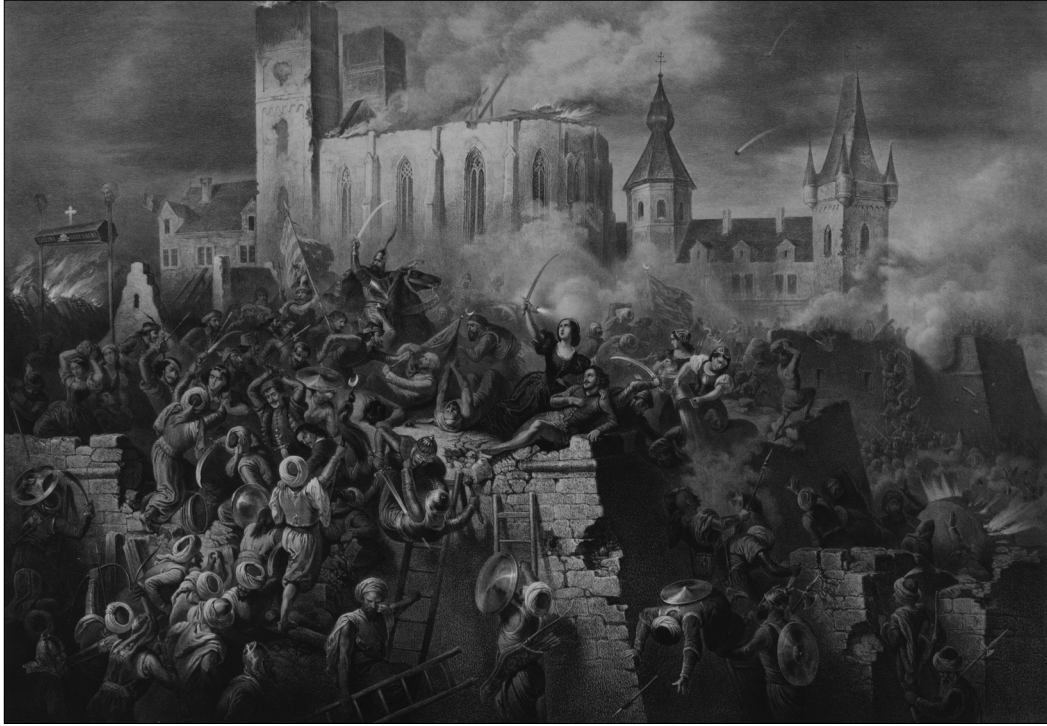
Vizkelety Béla – Franz Kollarz: Eger várának hősi megvédése Dobó és bajtársai és az egri nevet velök együtt kivívott magyar nők által, 1552-ben. Kőrajz. A Napkelet 1860. I. félévi műlapja. MNM TKCS, ltsz.: 4060

Értelmezése szerint Mátyás elsősorban „közpolgár” és hazafi, aki kivételes képességeinek és a közakaratnak köszönhetően uralkodói kiváltságait.