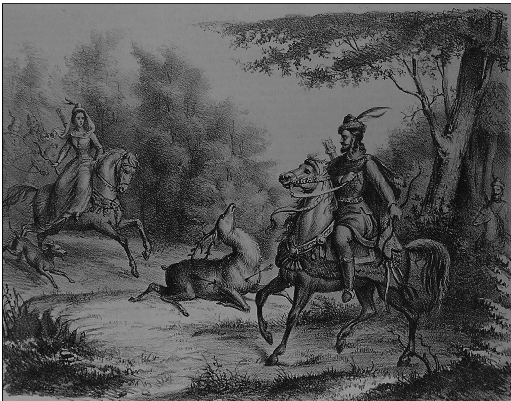
Vizkelety Béla: Sarolta, Gejza neje. Kőrajz. Az Ország Tükre , I, 1862. június 15. 12. szám, 181

A kompozíció nagy sikert aratott a közönség körében, kivitelét dicsérte a Déliabáb és a Vasárnapi Ujság is. 105 1858 október elején a lap lelkes műpártolója, Kulini Nagy Benő debreceni nemes, ahogy egy évvel korábban a Hunyadiház diadalünnepe kapcsán tette, most újra tíz aranyas pályadíjat tűzött ki a történeti jelenetet legjobban megverselők között. 106 A