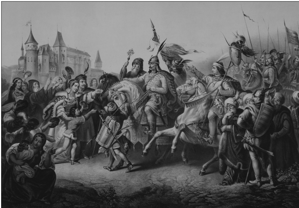
Vizkelety Béla – Franz Kollarz: Hunyadiház diadalünnepe, 1857. Kőrajz. A Napkelet 1857. évi jutalomképe MNM TKCS ltsz.: 4773