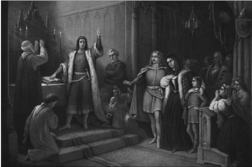
Vizelely Béla – Canzi Ágoston: V. László eskütétele. 1861. A Családi Kör 1861. évi műlapja. MNM TKCS, ltzsz.: 2815

kultúrtörténeti összefoglalására, amely „Kunst und Leben der Vorzeit” címen 1858-tól három kötetben jelent meg Nürnbergben. 40 Történeti arcképeihez a „Nemzeti Múzeumban lévő olajfestmények” között keresett mintákat, de Hieronimus Ortelius hadi krónikájának portrégalériájából is merített. 41 Egyik 16. századi hadi viseletet ábrázoló rajzához felhasználta a siposkarcsai várkastély építtetője, Dereghi Somogyi György 1581-ben állított emlékkövét, amelynek rajzát 1859-ben közölte Ipolyi Arnold a csallóközi műemlékeket bemutató kötete. 42 Ugyanebben a közleményben jelezte, hogy egy másik, 16. századi hadi viseletét Dobó István egri sírköve után mintázta. A fegyverek és páncélok megformálásának képi forrásaként pedig az Ambrasi gyűjteményt jelölte meg.