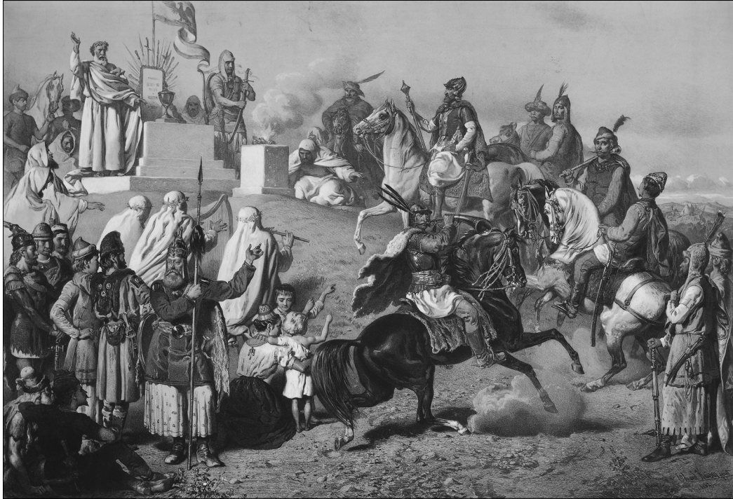
Vizkelety Béla – Eduard Kaiser: A hét magyar vezér megjelenése a pusztaszeri nemzetgyűlésre. 1862. Kőrajz. A Napkelet 1862. évi műlapja. MNM TKCS, ltsz.: 10.425