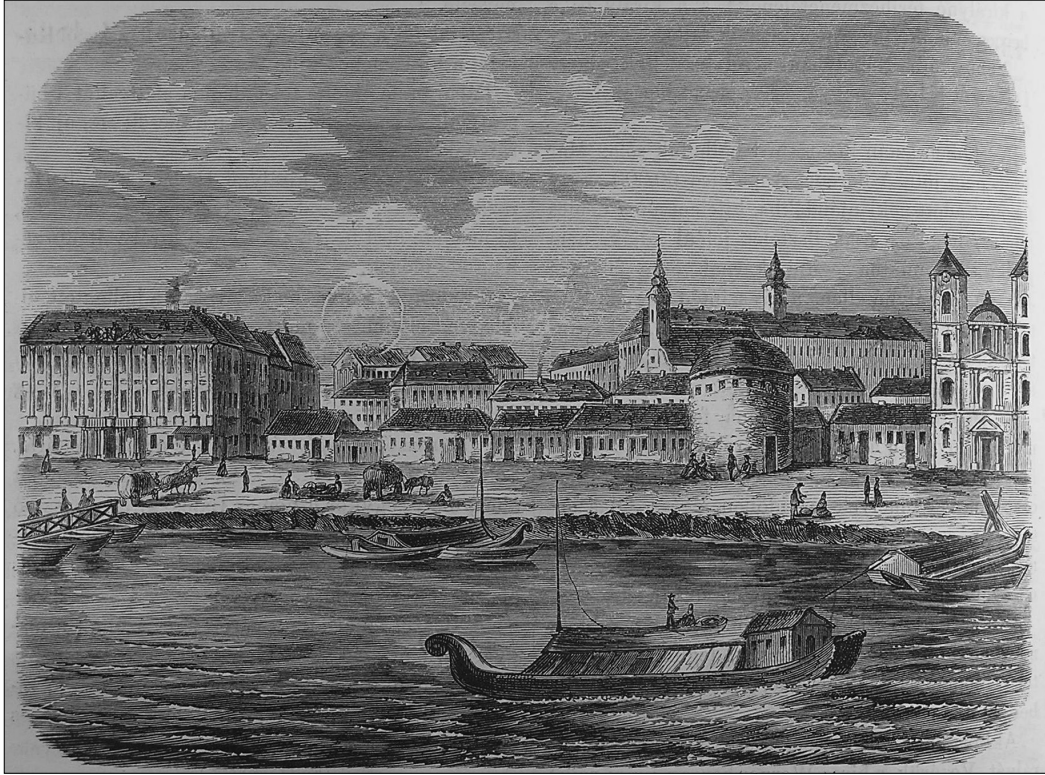
Vizkelety Béla: A pesti Duna-part 1800-ban. Fametszet. Hazánk és a Külföld , I, 1865/7, február 12., 100.