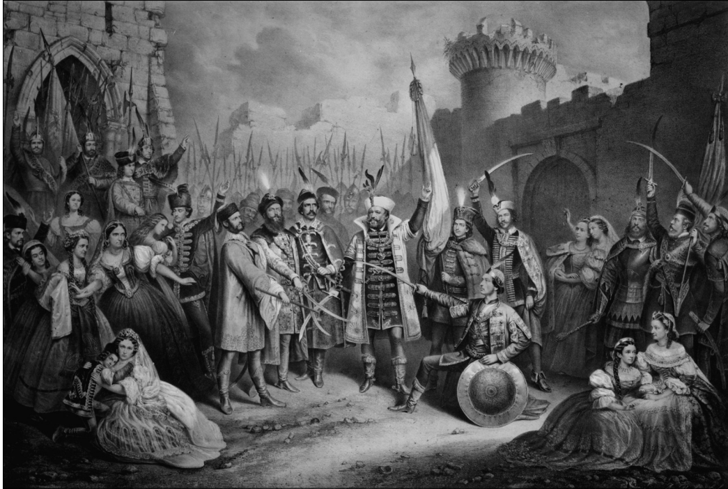
Vizkelety Béla – Rohn Alajos: Zrínyi esküje, 1860. Kőrajz. A Nefelejts 1860. II. félévi műlapja. MNM TKCS, ltsz.: 8183

teljesség állapota. Amint azt viseletképei illusztrálják, az akadémikus elvárásoknak megfelelően harmonikus, tetszetős látványt olykor különféle képi források kompilálása biztosítja. Legfőbb hivatásukat azonban mindezen elemek a mozgalmas, összetett történeti jelenetekbe illesztve töltik be.