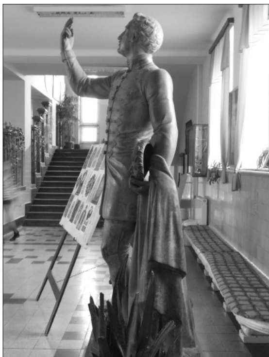
4. kép: Katona József szobra a kecskeméti Katona József Gimnáziumban.