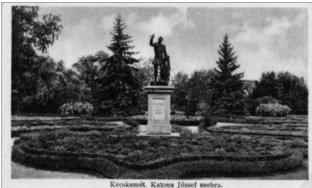
3. kép: A Katona szobor a kecskeméti Műkertben. Képeslap. A Korda R.T. kiadása. 1912 előtt készült felvétel 1930-as évekbeli kiadása. Kerekes Gyula gyűjteménye

az építendő színház előtti elhelyezést megelőzően a szobrot ideiglenesen „valamely téren” kell felállítani. A szobrot, melyet Kecskeméten csak vándorló vagy szédelgő szobornak neveztek, 1883-ban a Műkertben állították fel. „Ott szépen megékesítették futórózsákkal, és remélhető, hogy ezek a futórózsák idővel fölfutnak az egész szobor köré, föl egészen addig a lúdtollig, amelyet bronzkeze tart a magasba, nem lehet tudni: miért” jegyzi meg erről a fej-leményről is Lyka Károly. 42 (3. kép) 43