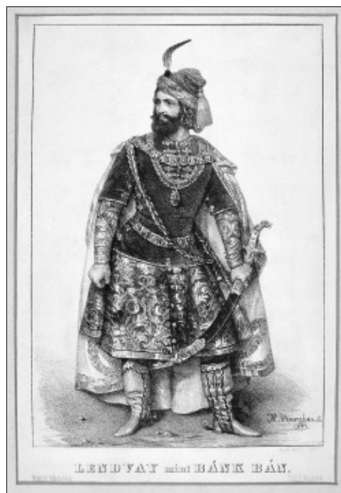
5. kép. Barabás Miklós: Lendvay Mint Bánk bán, 1845. Litográfia

A kész szobrot 1860. június 4-én állították fel a Nemzeti Színház előtti kiskertben. Az elhelyezésre a javaslatot maga Tomori