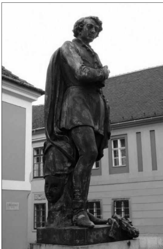
7. kép: A Lendvay szobor mai helyén.

Asasztáz tette, aki levélben kérte a színház igazgatóját, Ráday Gedeont, hogy az általa korábban megrendelt és kevésbé sikerültnek tartott Katona szobrot ideiglenesen cseréeljék le Lendvay szobrára, amíg a szintén Tomori által megrendelt új Katona szobor elkészül. 62 Ráday válaszában arra kérte Tomorit, hogy a Katona József iránti tiszteletből a szobrot ne távolítsák el végelegesen a színház területéről, hanem egy arra kijelölt helyen állítsák fel újra. 63 Így került a Dunaiszky Lendvay szoba a Züllich-féle Katona szobor helyére, míg a Bánk-bán írójának szobra átkerült a színház belső udvarára. Az újságok