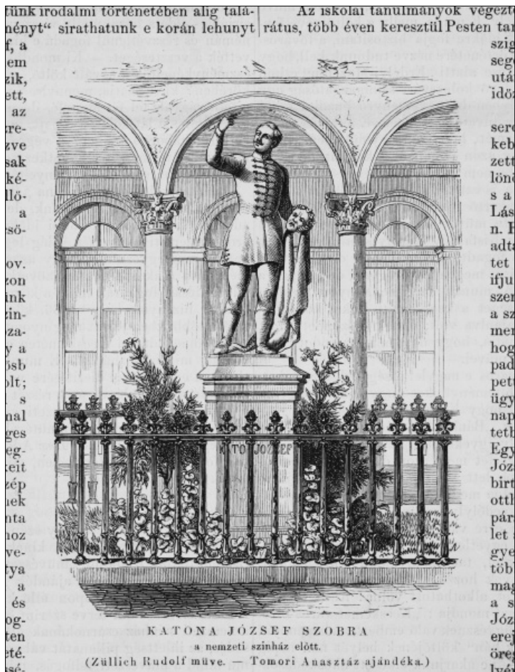
2. kép: Katona József szobra a Nemzeti Színház előtt. Vasárnapi Ujság, 1858., 5.évf., 42. sz., október 17. 493

legyen, mint olyan melyért pirulnunk kell. A hírlapok foglalkozzanak a kérdéssel, hiszen hazafiatlanabb nem tiltakozni oly mű nyilvános felállítására ellen, mellyel a magyar művészet s így közvetve a magyar nemzet nem becsületet vesz s melyért, ha ott hagyjuk, más nemzetek méltán kinevethetnek bennünket” írja. 37 Habár több folyóirat szerkesztője egyetértett Gregussal, sokallták azon állítását, miszerint a szobor nemzeti „becsületkérdés” lenne. 38 A Vasárnapi Ujság például védelmébe vette az alkotást, 1858-as októberi számában címlapon hozva a szobor rajzát, valamint kísérő szövegében megemlékezve Katona József munkásságáról és Tomori Anasztáz felajánlásáról – az emlékmű állításának más (nemzeti, kulturális, erkölcsi) aspektusból való szemlélését sugalmazva. 39 (2. kép)