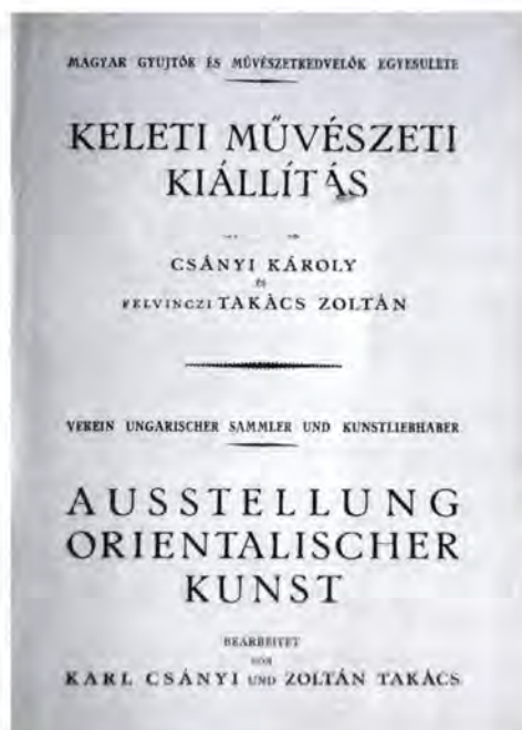
A Keleti Művészeti Kiállítás katalógusa, Budapest, 1929

irányt szabott a keleti művészet megismerésének, és felismerte azt a tényt, hogy a műkereskedelemből a magángyűjtők gyűjteményein, adományain keresztül vezet az út a közgyűjtemények gyarapításához.