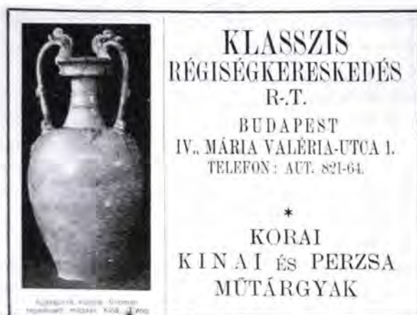
A Klasszis Rt. Régiségkereskedés hirdetése „A műgyűjtő” című lapban 1929-ben