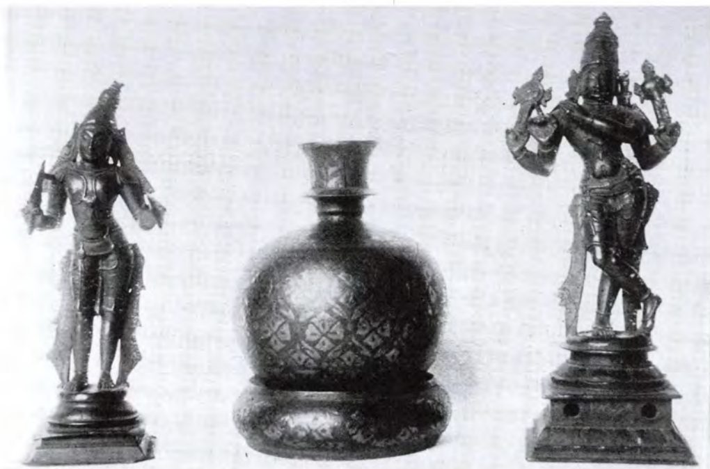
17—18. századi indiai szobrok és egy bidri váza gr. Zichy Rafael gyűjteményéből