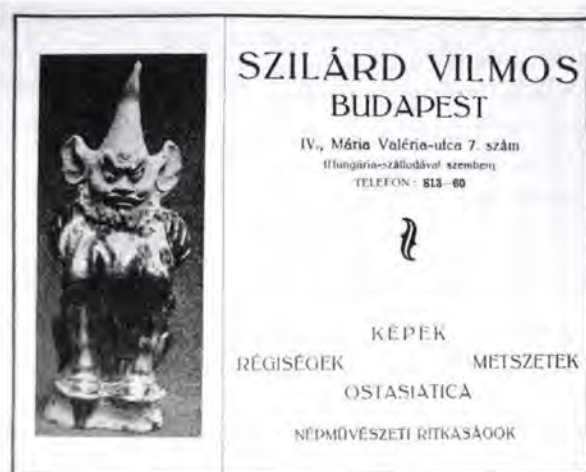
Szilárd Vilmos régiségkereskedő hirdetése „A műgyűjtő” című lapban 1929-ben