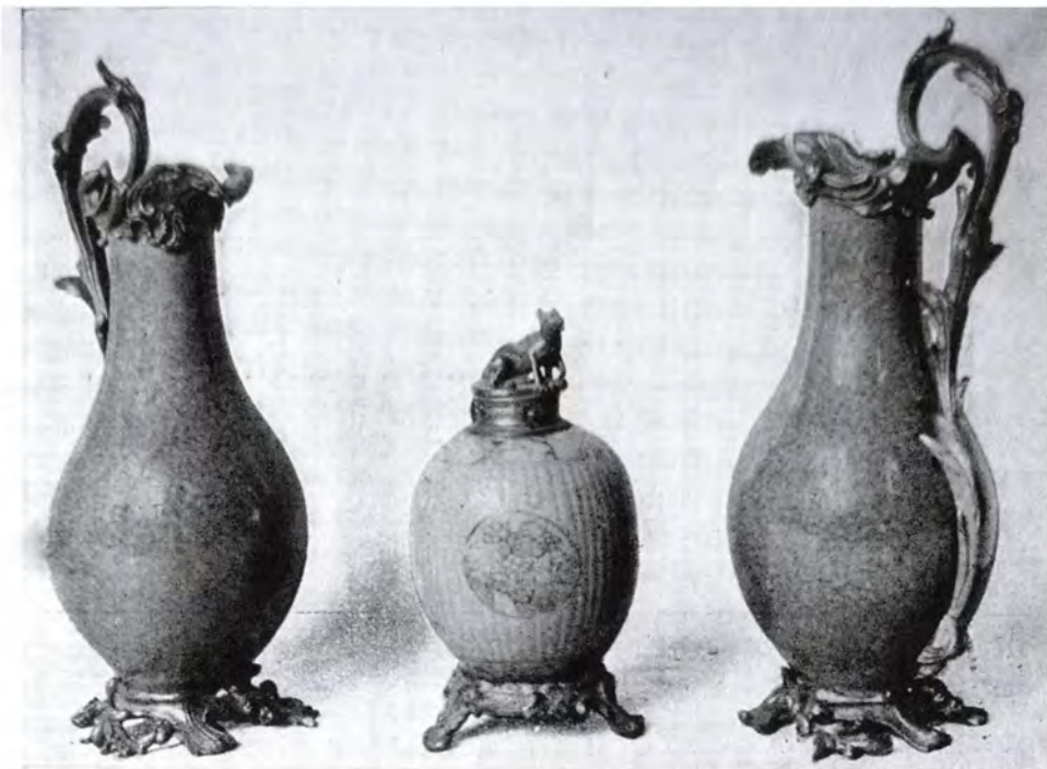
18. század elejéről származó, kínai, kék mázas váza-pár és egy tojásdad váza európai fémfoglatatban Weisz Béláné és Csányi Ilona gyűjteményéből