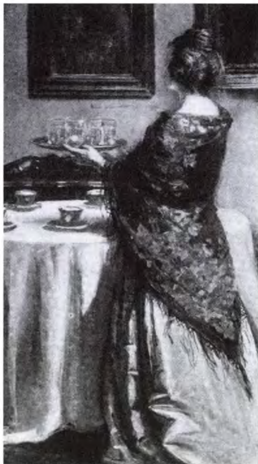
Márk Lajos: Szervírozás az uzsonnához. Közölve a „Művészet” 1907-es évfolyamában.