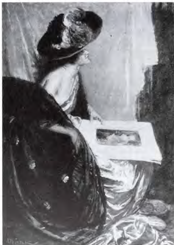
Márk Lajos: Képeslapok. Közölve a „Művészet” 1907-es évfolyamában.

lyeket kollégáiról rajzolt. 18 1897-ben a Salon des Champs Élysées tárlatán mention honorable díjat nyert. 19