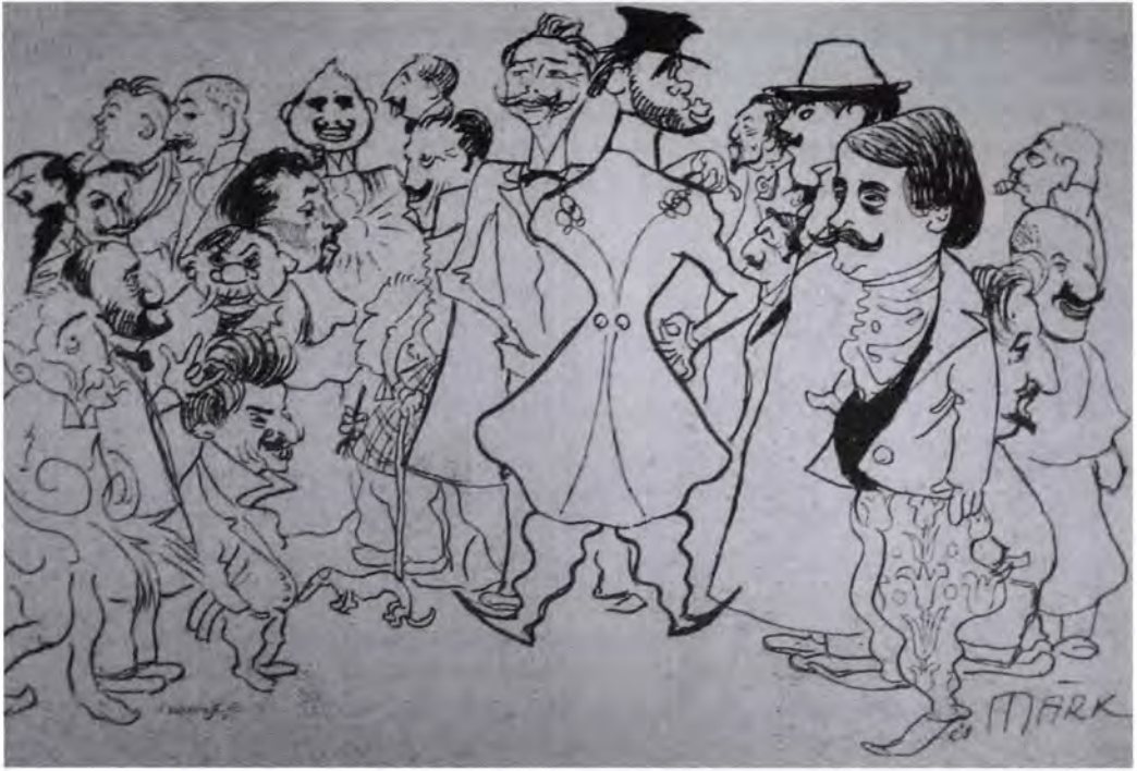
Márk Lajos: A Royalista Piktörök Társasága Vasárnapi Ujság, 1899, 46. évf. 6. sz., 96.