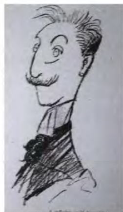
Márk Lajos: A művész önarcképe.

letett a Szolnok-Doboka vármegyei Ret-tegen. 3 Apja, Márk Márkus nemzetgaz-dasági szakíróként, bank-igazgatóként működött. 4 Szülei rövidesen Marosvásárhelyre költöztek, Márk ekkor öt-hat éves lehetett. Itt végezte elemi tanulmányait, 5 és visszaemlékezése szerint itt kezdett el palából zseb-kést, sarkantyút, pipát faragni. A faragót azonban hamar elnyomta benne a rajzoló: először az egyik szobájuk falán levő, magyar történelmi alakokat ábrázoló könyvmatát másolta le, majd tizenhárom éves korában Munkácsy Mihály Krisztus Pilátus előtt című képéről készített szénrajz másolatot. 6 A másolatot Pállik Béla, Keleti Gusztáv és Schickedanz Albert kiválónak tartották, és az ifjúnak — akit Keleti Gusztáv pártfogásába vett — 1882-ben nagy jövőt jósoltak. Marosvásárhelyről a család Budapestre költözött, és a fiú gimnáziumi tanulmányait a pesti piaristáknál és a kalocsai jezsuitáknál végezte. Első rajztanárai Domszék János, Pállik Béla és Köves Izsó voltak. 7 1885-ben a Greguss János és Székely Bertalan vezette Országos Mintarajz Tanodában folytatta tanulmányait. Itt előszeretettel rajzolt karikatúrát, s különös vonzalmat érzett a később gyakran ábrázolt társadalmi témák