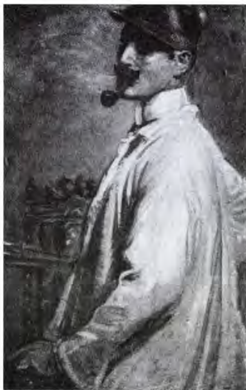
Márk Lajos: Önarckép.

Vászon, olaj, 95,5 x 67 cm. Magyar Nemzeti Galéria, Új Magyar Képtár, inv. no.: 73.108 T.