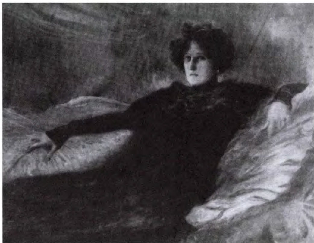
Márk Lajos: Női arckép. Közölve a „Művészet” 1907-es évfolyamában.

arcképein gyakran érzékelhető az angol portréfestők hatása. Aktjaiban — mint Lyka Károly írja — „...a pompás asszonyi állat mozdulatai” érdeklik leginkább. 25 Képeinek színezése néha a pointilisták színkezelési technikájára emlékeztet.