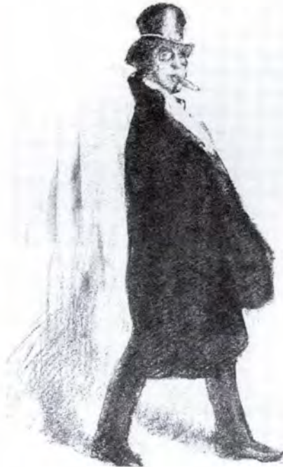
Márk Lajos: András. Illusztráció Herczeg Ferenc Andor és András című regényéhez, Budapest 1911.