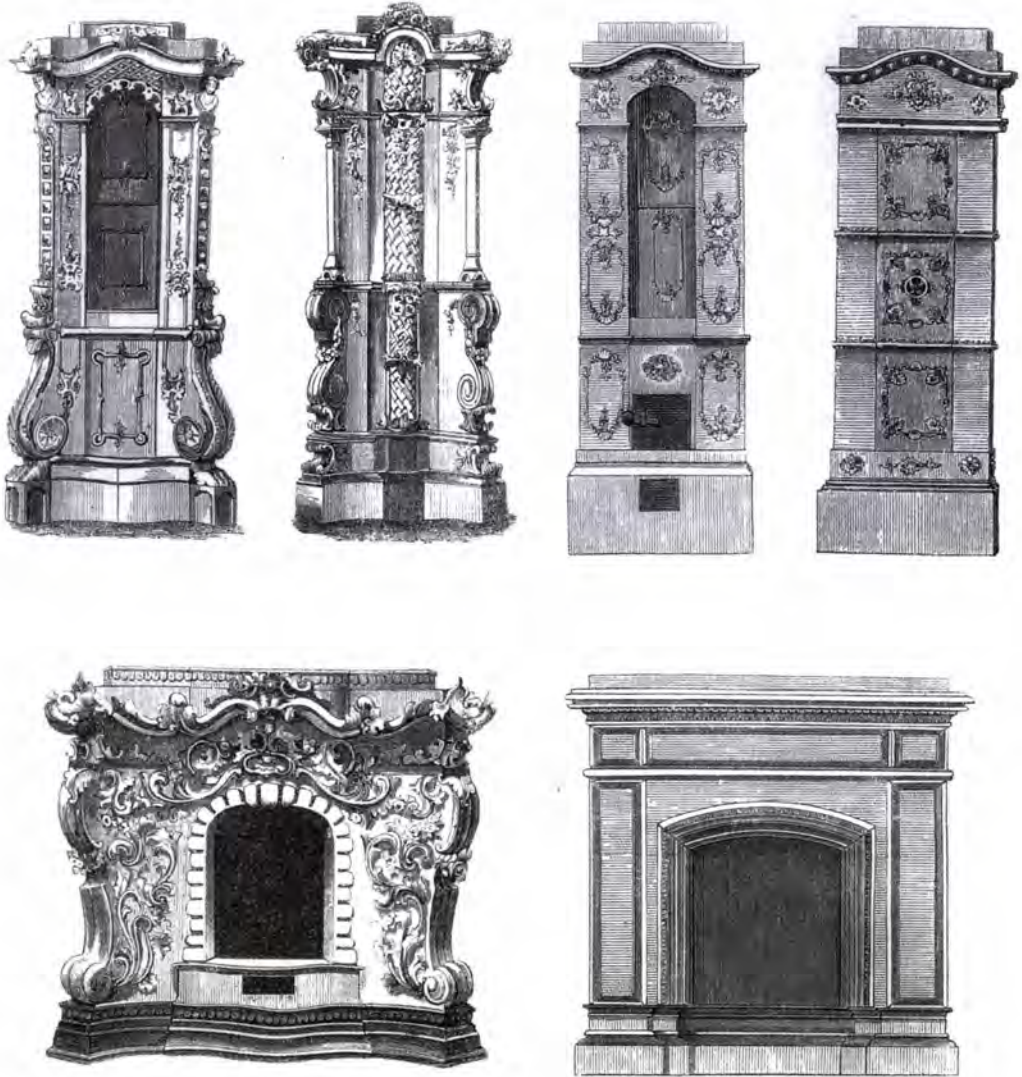
1. kép Részletek Prochaska András „Példány mustrájából”, 1864 -ből (FSzEK, Budapest Gyűjtemény)