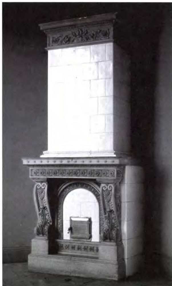
2. kép Kandallós kályha, - Prochaska András készítménye a Magyar Tudományos Akadémia, Kisfaludy Társaság termében.

A Magyar Tudományos Akadémia részére 1865–1867 között több alkalommal szállított kályhát. 1865. július 2-án 14 db kályháért 2800 Ft-ot vett fel. 17