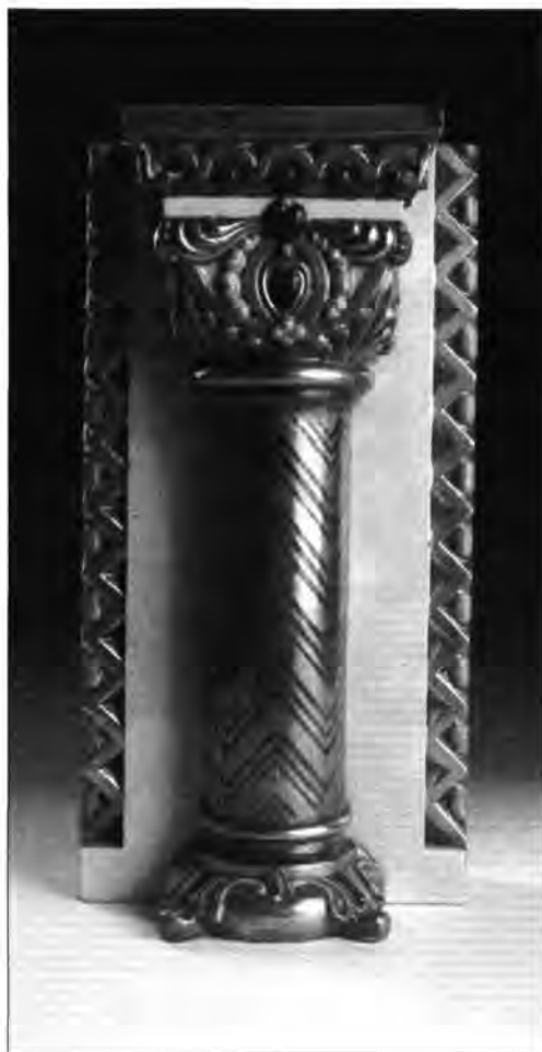
3.5.5. Oszlop részlete a Szent István-terem kandallójához.

ben, 100 amelyben részletesen ismerteti a sorozatot. A Szent István-teremben az Árpád-ház tíz tagja jelent meg: Szent Imre (a szent ifjúság jelképe), I. Béla (az 1051–1052-iki nemes háború lelke), Szent László, Kálmán, III. Béla, II. Endre (az Aranybulla adományozója), Szent Erzsébet, IV. Béla (Budavár alapítója), Szent Margit és III. Endre (az utolsó Árpád-házi király), továbbá két csoportkép: Szent István a keresztény vallást hirdeti és Szent István apostoli királlyá koronáztatása . 101 Az első nagyalakú, hármaskeretrel határolt kép közepén áll „...István, kezében kereszttel és Szent Móricznak a koronázási paláston is látható dárdájával, amely egy szöveget foglal magában a Krisztus keresztjéből. A király éppen a szé-