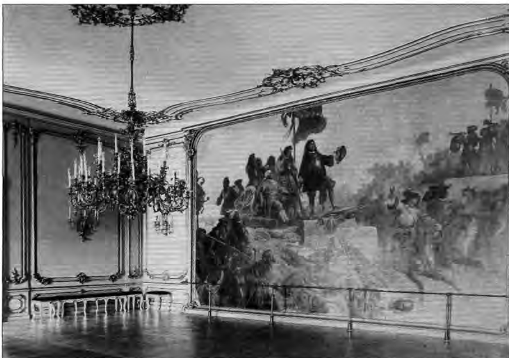
2.1.82. Az első előszoba a zentai csatát ábrázoló festménnyel, 1896.

tás, 15 000 forintért meg is vette, 31 s még az országgyűlés decemberi megnyitása előtt Pestre szállíttatta, ahol azt a Vigadó nagytermében közszemlére tették, majd elhelyezték a palota díszlépcsőházában. 32 Később a festmény (kat. sz.: 3.3.39.) az úgynevezett Zenta-szobába került (amelyet a kép után neveztek így), ahol különös mementóként 1945-ig őrizte a már rég széthullott birodalom összetartozásának nemzetek fölötti szellemét... A mű jellemző módon sohasem kapott helyet a magyarországi művészet számon tartott értékei között, bár nem maradt hatástalan a magyar történelmi festészetre. Ez a mű lett a nyitánya a kiegyezés után Pesten is megjelenő reprezentatív „dicsőség” képeknek, kutatója ebben látja Benczúr Gyula: Budavár bevétele, 1686 című grandiózus vásznának előzményét is. 33