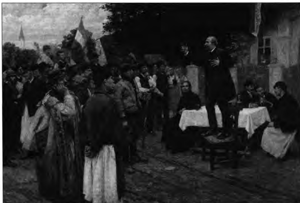
3.4.35. Bihari Sándor: Programbeszéd, 1890.