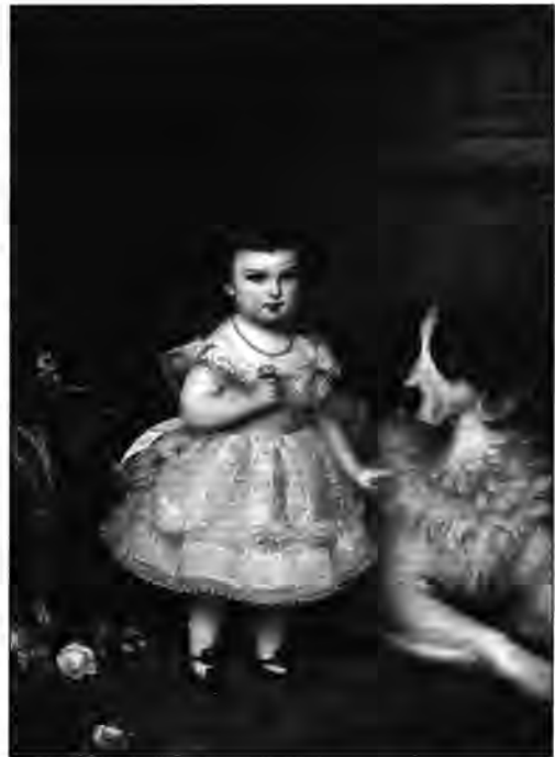
3.4.7. Franz Schrotzberg: Mária Valéria főhercegnő , 1870.

Az 1882-es pesti kiállításról került a palotába Vaszilij Vasziljevics Verescsagin (Cserepovec, 1842–?, 1904) Téli táj , 55 majd a műkereskedelemből Munkácsy Mihály (Munkács, 1844–Enderich, 1900) Hazafelé című alkotása, amelyet 1882-ben festett Colpachban Sedelmayernek, kifejezetten eladásra. 56 Megkezdődött a magyar tájképek módszeres gyűjtése, az első ilyenek egyike lehetett Molnár József (Zsámbék, 1821–Budapest, 1899) Az öt tó egyike a Magas Tátrában című alkotása 1887-ből. A fennmaradt reprodukció szerint a kompozíció rendkívül látványos volt, Molnár kutatója szerint a király ezt vette meg. 57 A későbbiekben több