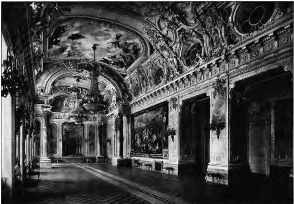
2.1.117. A büfégaléria, 1912. A mennyezetet Feszty Árpád: Árgyélus királyfi és Tündérszép Ilona című falképe. Jobbra a 3. számú lotharingiai falikárpit függ.

Nyilván jól meggondolt szándék következménye, hogy e várak látványa vezetett be a régi és az új épület-számnyat összekötő Habsburg-terembe, a teljes épületegyüttes új és hatásos centrumába. Itt a kupola alatt volt látható a palota egyik fő attrakciója, az ünnepelt falképfestő, Lotz Károly utolsó műve, az I. Ferenc