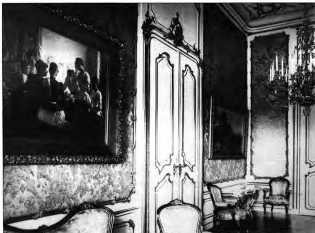
Szalón Pap Henrik: Zászlót himező lányok című képével (MNG, lt. sz.: 63.19T.). BTM Kiscelli Múzeum, lt. sz.: 60.395/5., neg. sz.: 28.591/6 × 9.

Szerencsére a Hunyadi Mátyás-teremből fennmaradt a két elkészült darab, a több mint négyméteres Benczúr Gyula-festmény, a Mátyás fogadja a pápa követeit (kat. sz.: 3.5.10.) és a Mátyás király bevonulása Budára . 105 Az alkotások az akadémizmus neoreneszánszba oltott példái, minden progressziótól távol álló mestermunkák, a XIX. századi historizmus végső kifutását érzékeltető művek – a XX. század első évtizedéből. A harmadik hatalmas Benczúr-kép, amely nem itt, hanem a hivatalos reprezentációt szolgáló helyiségben volt, a Millenáris hódolat I. Ferenc József és Erzsébet királyné előtt (1908), elégett. 106