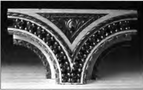
3.5.5. Párkány részlete a Szent István-terem kandallójához.