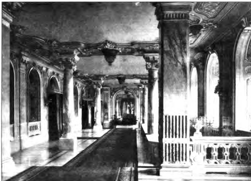
2.1.126. A földszinti előcsarnok, 1912.

A palota képe Hauszmann keze alatt teljesen megváltozott, de a dekórum által a korábbiakban kifejezett birodalmi eszme tovább élt, összeoldódva a magyar állami reprezentáció lehangoló megjelenésével. Egykor a keleti oldal császári traktusában (lásd kötetünkben Kelényi György cikkének képeit) a hivatalos események számára, valamint az uralkodópár – eredetileg Mária Terézia királynő és császárné és Lotharingiai Ferenc császár – személyes szükségleteire rendelt párhuzamos terem sor esztétikai hatásának a középpontok felé való fokozása az uralkodói hatalom mindjobban kibontakozó érzékeltetése jegyében történt. A visszafogottabb kiképzésű előszobák készítettek fel egyrészt az intim részek műalkotásokkal és értékes bútordarabokkal kialakított művészi élményére, ahol a hálószobában felállított fejedelmi ágy volt az épület „szíve”. A másik