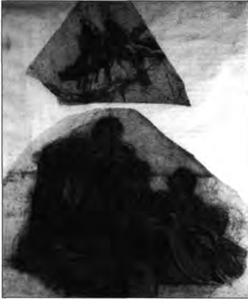
1.1.1. Lotz Károly falképkartonja a Habsburg-terem kupolfreskójához. I. Ferenc József és Erzsébet apoteózisa, 1904.

a fogadó- és egyéb termek supraportái. Ez az elképzelés nagyrészt meg is valósult.