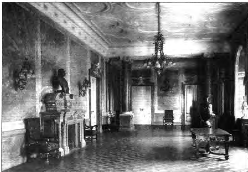
2.1.72. Az első emeleti előcsarnok, 1912. Balra: Zala György Deák Ferenc-szobra, jobbra Füredi Rikárd: Mária Terézia-korabeli testőr (kat. sz.: 3.1.12.).

fronton, a hálószobával átellenben, egyre növekvő fény és pompa közepette tárult fel a hivatalos állami reprezentáció centruma, a nagy trónterem , ahol az egész épület gyújtópontja, az aranyozott trónus állott.