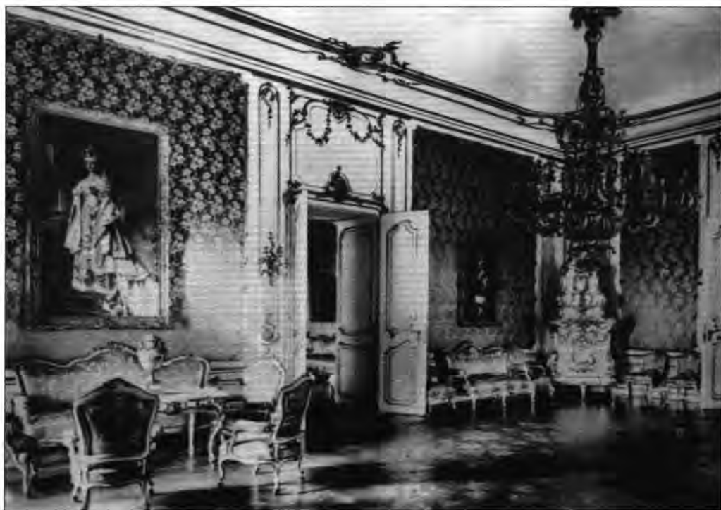
Az egykori déli tükörterem. Baloldalt Benczúr Gyula: Zita királyné koronázási díszöltözetben, az ajtó másik oldalán Benczúr Gyula: Ottó királyfi portréja (MNMTKcs, lt. sz.: 1887.) című képe.