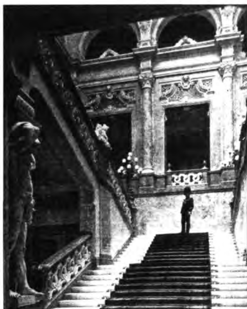
2.1.69. Főlépcsőház a krisztinavárosi szárnyban, 1912. Lenti baloldalt Fadrusz János Atlasza (ma az OSzK díszlépcsőházában).

szerte ismert lengyel csataképfestő Jelenet a königgrätzi csatából 90 című képe. (Ez Miklós cárnak volt szánva ajándékol, de a háborús helyzet megakadályozta elküldését.) Később az egyik Rózsaszobát Rákóczi-emlékhelyként rendezték át. Ide került Mátyóki Ádám 91 II. Rákóczi Ferenc és felesége, valamint két gyermekük portréja, 91 továbbá itt állt Holló Barnabástól (Alsóhadony, 1865–Budapest, 1917) a fejedelem bronz lovasszobra. 92