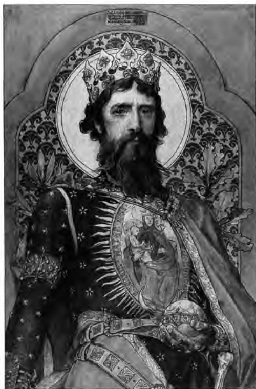
3.5.3. Roskovics Ignác nyomán Nikelszky Géza: Szent László király,

pirogránit alpra készültek, a kivitelező Nikelszky Géza (Szatmárnémeti, 1877–Pécs, 1966). A pirogránit, egy rendkívüli keménységű majolika, amely szépen festhető és égethető, Zsolnay Vilmos szabadalma volt, ekkor mint elsőrangú magyar találmányt ünnepelték, s az 1900-as Párizsi Világkiállításon világhírt szerzett a magyar mérnököknek. A kivitelezés a pécsi Zsolnay gyárban történt, a palotával egy időben épülő Parlament és Nagyboldogasszony (Mátyás)-plébániatemplom ugyancsak pirogránit díszével együtt.