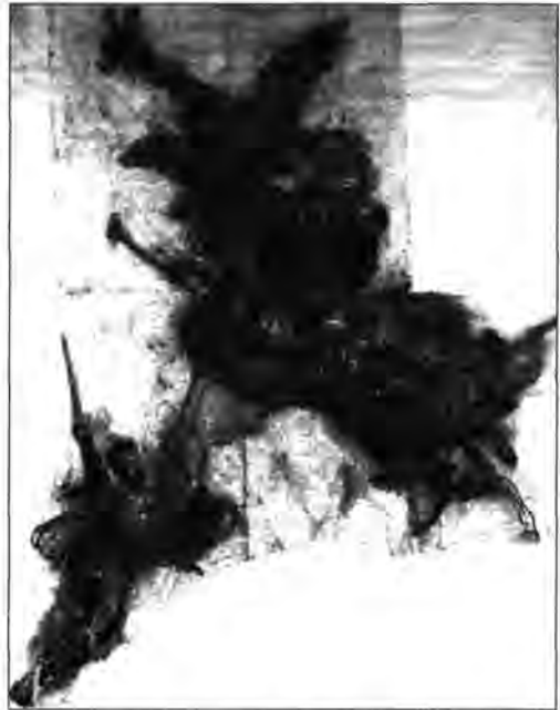
1.1.3. Lotz Károly falképkartonja a Habsburg-terem kupolafreskójához. A Háború allegóriája, 1904.