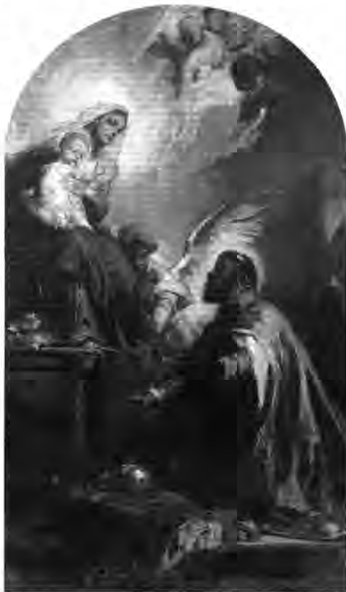
3.4.1. Benczúr Gyula: Szent István felajánlja a koronát Máriának , 1887.

sz.: 3.4.1.). 10 A Szent István-kápolna feladata volt a Mária Terézia által 1771-ben idekerült Szent Jobb, valamint a II. József rendeletére halála után, 1791-ben visszaszállított magyar uralkodói jelvények őrzése. A klenódiумokat nevezetes események alkalmával – egészen a XX. század közepéig – háromnapos közszemlére tették, amit Budán mindenkor a magyar história nagyhatású felidézéseként éltek át az alattvalók.