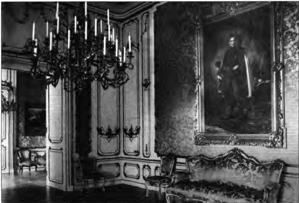
Kis szalon. Jobbra I. Ferenc József fiatalkori képe magyar ruhában (azonosítatlan).

A Mária Terézia-szárnyban a nagy szertartási terem (trónterem), a kis trónterem és a négy előterem patinás miliője fogadta magába az egykor magyar királyként uralkodó Habsburgok galériáját. A kis trónteremben III. Károly , II. Lipót , II. József és I. Ferenc József reprezentatív, életnagyságú portréja (ez utóbbi Liezen-Mayer Sándortól), a Lila szobában a tizenhét éves Ferenc József , 86 I. Ferenc és V. Ferdinánd arcképe, a Sárga szobában pedig I. Ferenc Józsefet osztrák tábornoki egyenruhában ábrázoló arckép függött (azonosítatlanok). A Kék teremben Mária Terézia (kat. sz.: 3.1.5.), Lotharingiai Ferenc (kat. sz.: 3.1.4.) és a császári