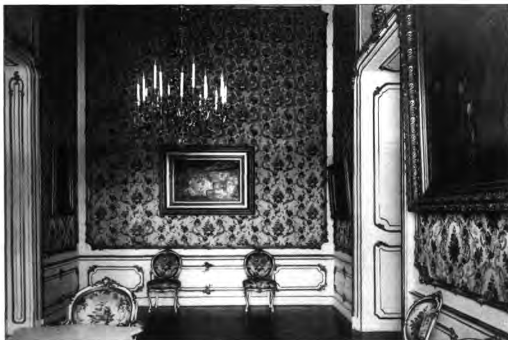
2.1.75. A főhercegi fogadóterem, 1912.

A palota hagyományos funkciói mellett nem utolsósorban a kortárs magyar szakemberek világraszóló bemutatkozóhelyévé vált. Mint a budapesti Operaház és Parlament hangsúlyozottan magyar erővel, magyar anyagokból épült, ezt a feltételt törvénybe is foglalták. (Óva intek attól mindenkit, hogy a reformkortól kibontakozó, a „nemzeti iskola” megteremtésére irányuló vágyat a mai politikai törekvésekkel vessen össze. A „magyar mester” kizárólag annyit jelentett, hogy a művészi megbízásokat hagyományosan ellátó osztrák mesterek ellenében magyarországi születésű, itt meghonosodott vagy csak helyben lakó legyen a megbízott, és még ezt is igen liberálisan kezelték.) Az intézkedés fő célja az önálló magyar művészet megteremtése volt.