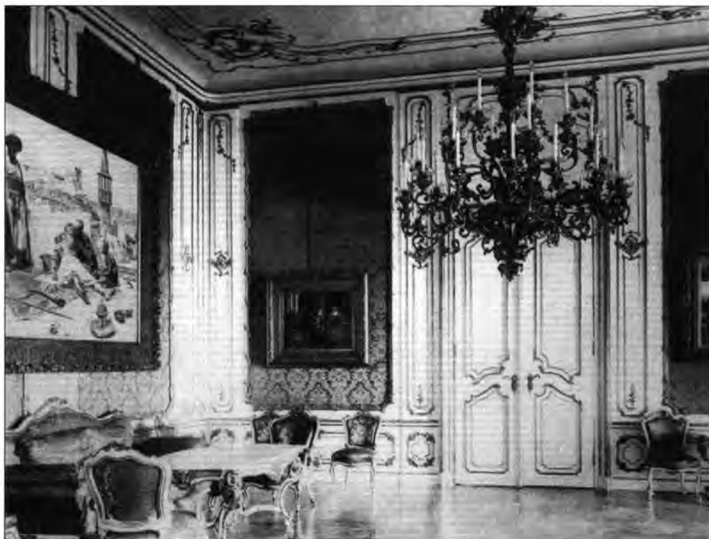
Salon Eisenhut Ferenc: Gül baba halála című képével (elpusztult). BTM Kiscelli Múzeum, lt. sz.: 60.395/8., neg. sz.: 25.368/6 × 9.

Végül az egykori kápolna oltárképeit említeném. A Szent István- (1900-ig Szent Zsigmond-) kápolna főoltárképe, Benczúr Gyula: Szent István felajánlja a koronát Máriának (vázlata: kat. sz.: 3.4.1.) és a két mel-