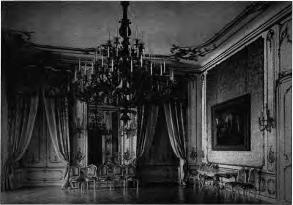
Teázóterem a királyi palotában. BTM Kiscelli Múzeum, lt. sz.: 60.395/12., neg. sz.: 28.595/6 × 9.

József és Erzsébet apoteózisát ábrázoló freskósorozat (lásd a 424. és 425. oldalon; vázlatai: kat. sz.: 1.1.1–4.). A nagyszabású kompozíció a kupola égésekor megmenekült ugyan, de az 50-es években a beázások megsemmisítették. A mester a munka megkezdése előtt Würzburgba utazott Tiepolo munkáit tanulmányozni, s ő maga állította össze a képsorozat programját az évszázadok óta ismétlődő számos hasonló falképciklus toposzai szerint, amelynek deklarált vezéreszméje: a jólét és kultúra kibontakozása az uralkodói erények által. E program tőlünk nyugatabbra már kibírhatatlan közhely, de itt, ahol a kultúra bizonyos területein még mindig nyomasztó az utolérési komplexus, a beteljesülést jelentette, és a Királyi Váreépítési Bizottság, Podmaniczky Frigyes báró elnöklétével, ugyanolyan elhivatottsággal állt a mester mellett, mint 15 évvel korábban az Operaház falképsorozatának esetében. 82