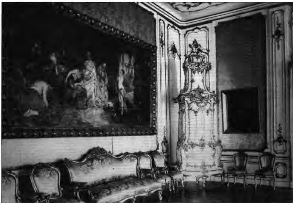
Szalon Tornai Gyula: Salome táncja című képével (elpusztult). BTM Kiscelli Múzeum, lt. sz.: 60.395/10., neg. sz.: 25.370/6 × 9.

A Szent István-terem fő attrakciója az Árpád-házi királyokat és szenteket ábrázoló tíz képből és két nagyméretű supraportából álló sorozat volt. Az iniciátor, Roskovics Ignác kartonjai után a „kőbe égetett képek”