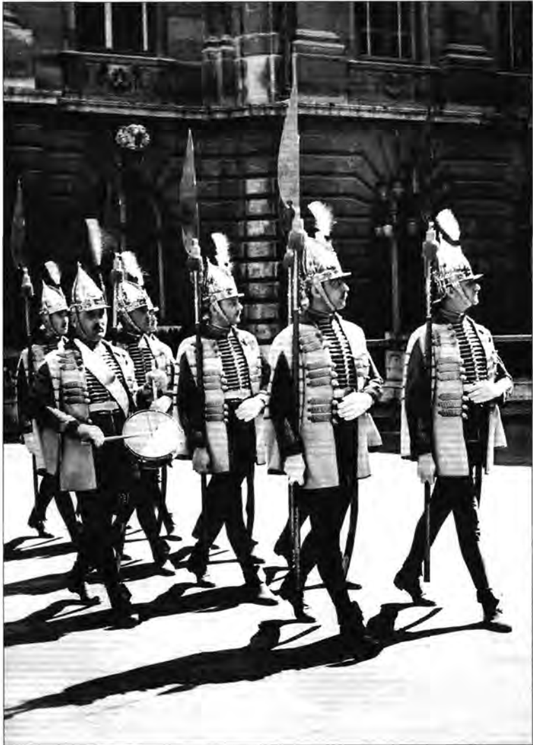
3.6.20. Alabárdos testőrök a Szent István-napi körmenetkor, 1941. augusztus 20.

1930-ra alakult ki a királyi vár kormányzói gárdistáinak teljes öltözeti rendje, amely néhány kisebb változtatástól eltekintve fennmaradt Horthy Miklós 1944 őszi hatalomból való eltávolításáig. A testőrök számára udvari díszöltözetet, udvari szolgálati öltözetet, menetöltözetet, nagytársasági öltözetet, kistársasági öltözetet és köznapi öltözetet állapítottak meg. Az 1930-as szabályozás szerint az udvari dísz változatlanul a régi, csupán az övcsat addigi középdiszét, a királyi névjelet cserélték magyar koronára. Udvari díszben a lovas testőrség is ezt a ruhát hordta, de a huszárosabb küllem kedvéért a zeke helyett piros mentével, a cipő helyett sárga csizmával. A lovasok a jellegzetes fém testőrsisakot, a „Zrínyi-sisakot” 1937-ig viselték, ekkor ugyanis – jellegében ugyancsak huszáros – új főveget, arany paszományos vörös posztót, „szárnyas” testőrsüveget kaptak. 20