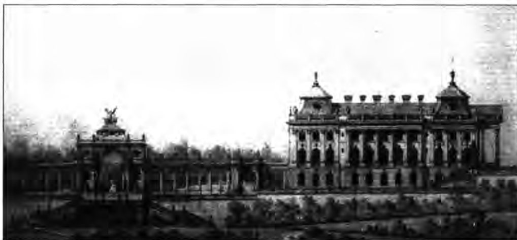
2.1.120. Ybl Miklós: A tervezett összekötő kolonnád és a királyi testőrlakház keleti homlokzata, 1885.

Az augusztus 20-i a Szent István-napi körmenetek egyik fontos állomása a királyi vár. A királyi várkápolnánál kezdődő körmenetben a Koronaőrséggel és képviselőházi őrséggel kibővített testőrség a korabeli hivatalos Magyarország díszbe öltözött méltóságai között vonult a Mátyás-templomhoz. Külföldi állami méltóságok fogadásán, követek megbízólevél-átadásán, illetve búcsúkihallgatásán a ceremóniák az újévi szabályok szerint zajlottak.