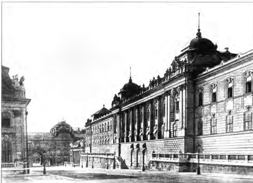
2.1.134. Az istállóépület főhomlokzata, 1912.

Az udvar különleges alkalmi rendezvényei (bálok, fogadások, eskütetelek, díszbeédek, újévi köszöntők, delegációk fogadása, udvari esküvők, keresztelők, koronaőrök ünnepélyes felesketése, az országgyűlés megnyitása és bezárása) a testőrök számára ünnepi szolgálatot jelentettek. Igazi reprezentatív esemény a palotában az udvari bál, helyszíne a „Nagy ünnepi terem”. Ahol a vendégek megfordulhattak, az ajtók, átjárók előtt őrök álltak párosával. Kettő a főbejárat második ajtajánál, kettő a diplomáciai testület bejáratánál, továbbá a „Zenta-kép”, illetve a „Koronázási kép” szobájába vezető ajtónál. Delegációk fogadásánál – ennek helyszíne a vár kihallgatási szobája volt – két testőr állt a Zenta-kép szobája és a Fehér terem közötti folyosón, egy pedig a Koronázási kép szobája előtt. Ugyanezt a szolgálatot írták elő a koronaőrök eskütetele alkalmával is. Az udvari ebédeket a Szertartási teremben tartották, az őrök ilyenkor a Koronázási kép szobájának ajtaja előtt álltak.