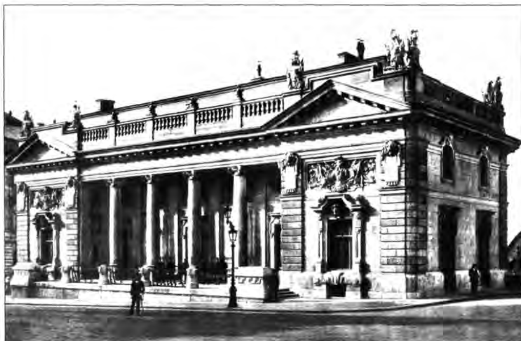
2.1.136. Az őrség épülete, 1912.

jén a Horthy mellett maradt testőrség hiúsította meg a Baky vezette puccsisták terveit. 1944. október közepén a fegyverszüneti proklamáció és a nyilas hatalomátvétel napjaiban pedig valódi szerepüket is eljátszhatták: október 15–16-án a testőrök kisebb csatát vívtak a várat megszállni akaró német és nyilas csapatokkal. 18 A nyilas hatalomátvétel után a testőröket a Szent László-hadosztályba, harctéri szolgálatra osztották be. A várban, Szálasi környezetében „új testőrségként” a 9/II. zászlóalj katonáiból alakult különítmény maradt, Mészáros István alezredes parancsnoklása alatt.