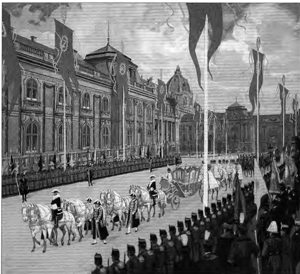
3.5.16. Kós Károly terve: A Palota út a királyi pár diszfogatával.

A Koronaőrseget a kiegyezés után, 1872-ben létrehozott Magyar Királyi Honvédség állományába helyezték át, ahol a testület a honvéd gyalogság egyik „kikülönített alosztálya” lett. Létszáma: 2 tiszt és 45 „köz”-