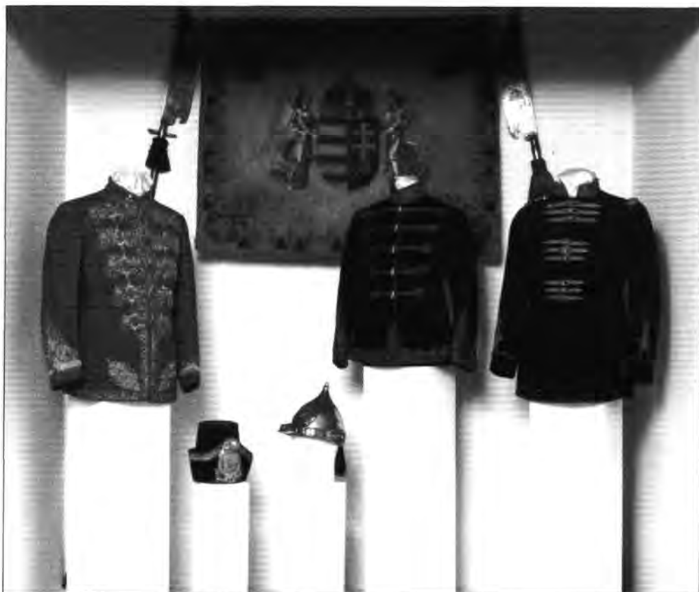
Jobbról balra: 5.1.1. Testőr díszatilla, Magyar Királyi Testőrség, 1869–1918; 5.1.2. Testőrtiszti szolgálati atilla, Magyar Darabont Testőrség, 1904–1918; 5.1.3. Koronaőri díszsisak, Magyar Királyi Koronaőrség, 1871–1909; 5.1.4. Koronaőri díszföveg, Magyar Királyi Koronaőrség, 1909–1944; 5.1.5. Lovastestőr-tiszti szolgálati atilla, Magyar Királyi Testőrség, 1930–1944.

Volt „egyszerű” díszviselete is a magyar testőröknek. Akik tábournoki rangban álltak, hordhatták a magyar öltözetű tábornokok szolgálati díszruháját, a csukaszürke atillát és a lampaszos fekete pantallót, de nem csákovával, mint a katonák, hanem asztrahán kucsmával, amelyből kócsagforgó magasodott ki, bal oldalán pedig skarlátpiros leffentyű csüngött alá. A tisztí rangúak – lényegében az összes testőr – kucsmájának buzérvörös leffentyűje volt, huszáros mentéjük és atillájuk színe sötétzöld, nadrágjuk buzérvörös, csizmájuk fekete.