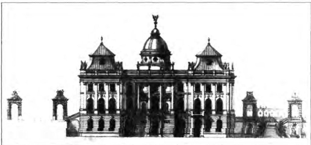
2.1.123. Ybl Miklós: A tervezett királyi testőrlakház déli homlokzata, 1885.

Az őrk posztolási helyét a szolgálati szabályzat írta elő. 15 Az udvarlakai őrség a palota nehezebben megközelíthető részeiben, többek között az alsószori Ezüstkamra előtt, illetve külső helyszíneken (például a Várkert különböző pontjain) teljesített szolgálatot. A puskás őrségnek hét szolgálati helye volt: a Iustitia-szobornál, az előcsarnokban, a távirtda kapujában, a Korona lépcsőn, a várkapitányságnál, a gazdasági kapunál, az északi szárny bejáratánál. A nyolcadik helyet, az úgynevezett mozgór járőr töltötte be, aki a felállított őrk ellenőrzését végezte. Az alabárdos testőrségnek két mindennapos őrhelye volt, mindkét helyen két-két őrral. Az egyik páros a Deák csarnokban, a szárnysegédi iroda bejáratú ajtajánál állt, s mivel a kormányzó dolgozószobája a szárnysegédi irodából nyílt, ők valójában Horthy személye körül reprezentáltak. A másik pá-