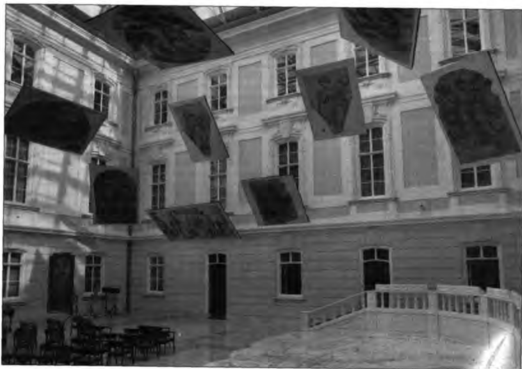
A Budapesti Történelmi Múzeum barokk terme Lotz Károly és Than Mór falképkartonjaival

Az eleven művészeti élet létezése – mint az emelkedés egyik rangos mutatója – Magyarországon a reformkor óta politikai kérdés. Az „utolérési komplexum”-tól serkentett reformerek, akik arra vágytak, hogy Európa művelt nemzetei közé soroljanak bennünket Nyugaton is, a művészetet a kulturáltság bizonyítékának tekintették, és ezért ápolását tevékenységük részévé tették. A köz-