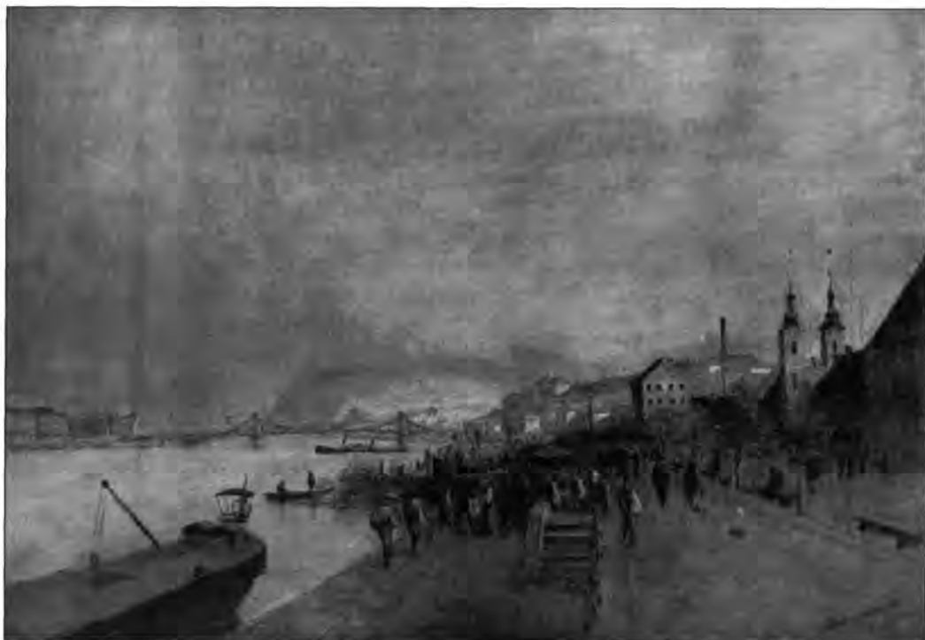
L.13. Mednyánszky László: Lánchíd (Budai Duna-part), 1884