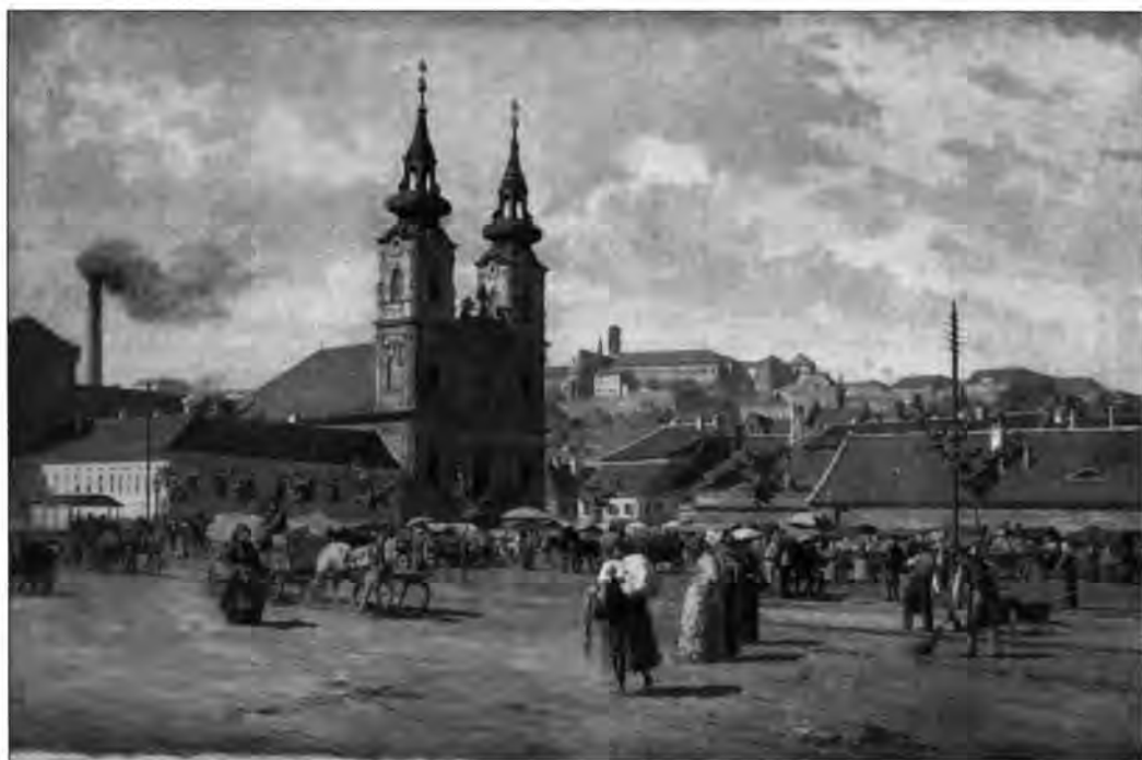
L.15. Nádler Róbert: Bomba tér, 1885–87

és Duna utca sarkok, 4. ferenciek tere. Molnár Józseftől: Calvin tér. Feszty Árpádtól: 1. a lánchíd este, 2. alsó dunai látkép. Aggházy Gyulától: Albrecht út alulról, Ballótól: Petőfi tér, Tölgyessytől: Sugárút, Lechner Gyulától: váci utca a Kristóffal. 37