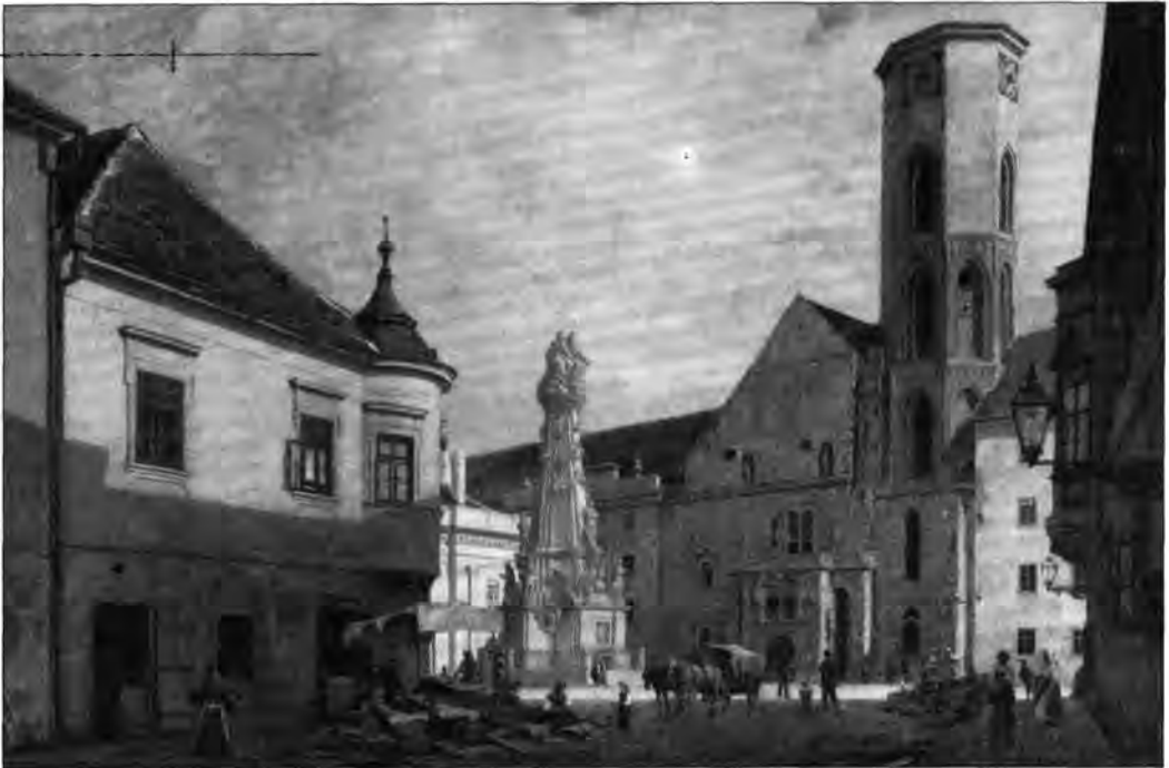
L.18. Schickedanz Albert: Mátyás-templom (Szentháromság tér), 1890–1892

képzőművészeti bizottmány; ekkor megrendelték Schickedanztól a Mátyás-templom , Nádlertől a Királyi lak hátsó részének lefestését. 43 A képek 1892-ben elkészültek, és a főváros átvette őket. 44 A főváros által festetett, illetve megvásárolt képeket a Városháza hivatali helyiségeiben helyezték el, majd 1900–1906 között több részletben átengedték a kevéssel korábban alakult Fővárosi Múzeumnak. 45 A Fővárosi Múzeum, a Fővárosi Képtár, majd a Budapesti Történeti Múzeum feladatának tartotta a városképek gyűjtését, így lehetőségei szerint megvásárolta a műtárgypiacon feltűnő, a témára vonatkozó képeket is. A pályázat anyagából 1901–1955 között húsz további kép került vásárlás útján a múzeum, illetve a Fővárosi Képtár tulajdonába. 46