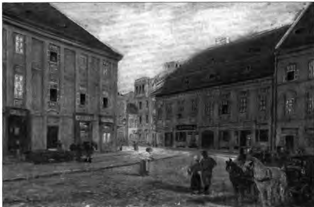
L.10. Lechner Gyula: Rózsater (Sebestyén tér), 1884

lóban bonyolultabb feladatot jelentő történeti festmények díjazására általában egyetlen 500 forintos díj állt rendelkezésre.) A pályaművül megkívánt színvázlatok szélességi méretét 60 cm-ben határozták meg, olyan kiegészítéssel, hogy azok másfél méter széles és egy méter magas végleges festmények alapjául szolgálhassanak. (A majdan megrendelendő nagyméretű festmények árát is megjelölték 1200 forint összegben.) A pályázat határideje eredetileg 1884. október elseje volt, amelyet később meghosszabbítottak 1884. december 31-ig.