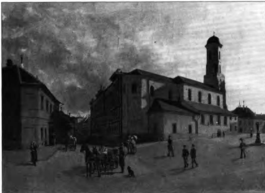
L.6. Győrök Leó: Garnison templom (Helyőrségi templom), 1884

A pályázat kiírásakor már másfél évtizedes hagyománya volt Magyarországon a tematikus fes-