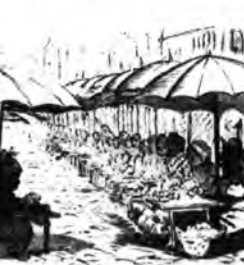
A feldunapart árnyas söfái.