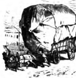
Állatkínzás elleni egyletek.