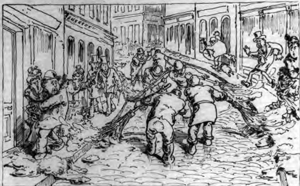
délután meg a kocsijutjaikat.

egyeduralkodó volt a sajtógrafika és karikatúra területén. Jankó egyénileg inkább függetlenségi érzelmű volt, a nagyobb odaadás olykor meg is látszott ellenzéki indulatú karikatúráin, de általános foglalkoztatottsága miatt inkább az adott élclapra és szerkesztőre volt jellemző Jankó karikatúrája, önmagában nem alakított ki sajátos szemléletet. Klic kötődése a kormánypárti és ekkoriban még következetesen modernizációs szemléletű Borsszem Jankó hoz megkönnyítette számára az egyneműbb karikaturistamunkát is. Klic a szerkesztővel, Ágai Adolffal meglehetősen rokon világnézetet képviselt, de egyénisége és vonalvezetése mindig felismerhetővé tette rajzait – Jankó János viszont hol Ágai ( Borsszem Jankó ), hol Jókai, majd Szabó Ede ( Üstökös ), hol Tóth Kálmán ( Bolond Miska ), hol Bartók Lajos ( Bolond Istók ) szócsöve volt.