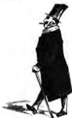
Tiskári: Csipőse az idő.