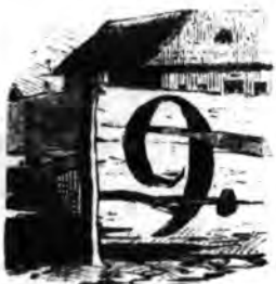
Egy hotel az állói áton.