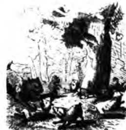
A városligeti állatkert.