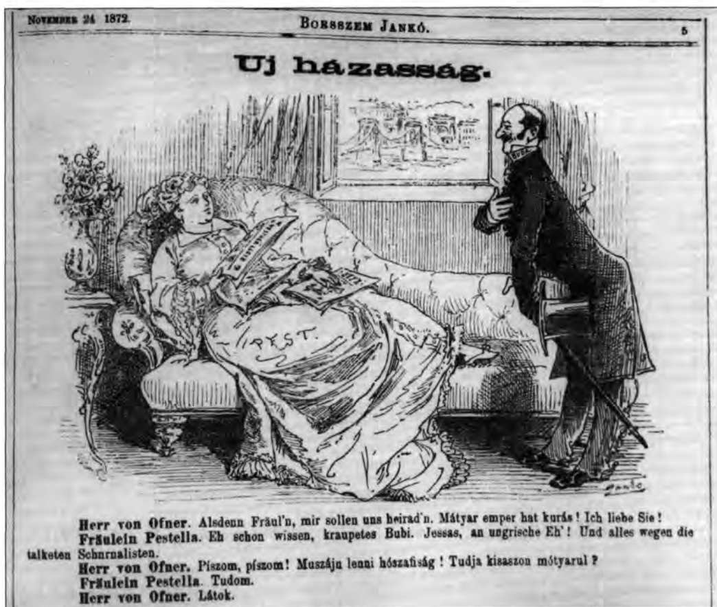
1. kép. (1.4.2.) Jankó János: Új házasság, Borsszem Jankó, 1872.

A karikatúra grafikai eszközökkel uyanazt teszi, mint amit a vicc szöveges megformálással,