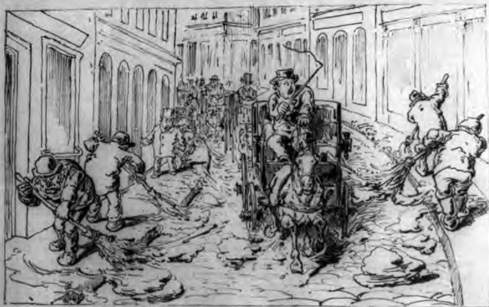
Azok a boldog pestiek! Délelőtt a járdáikat tisztogatják —