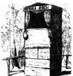
A „pestvárosi” magyar színház.