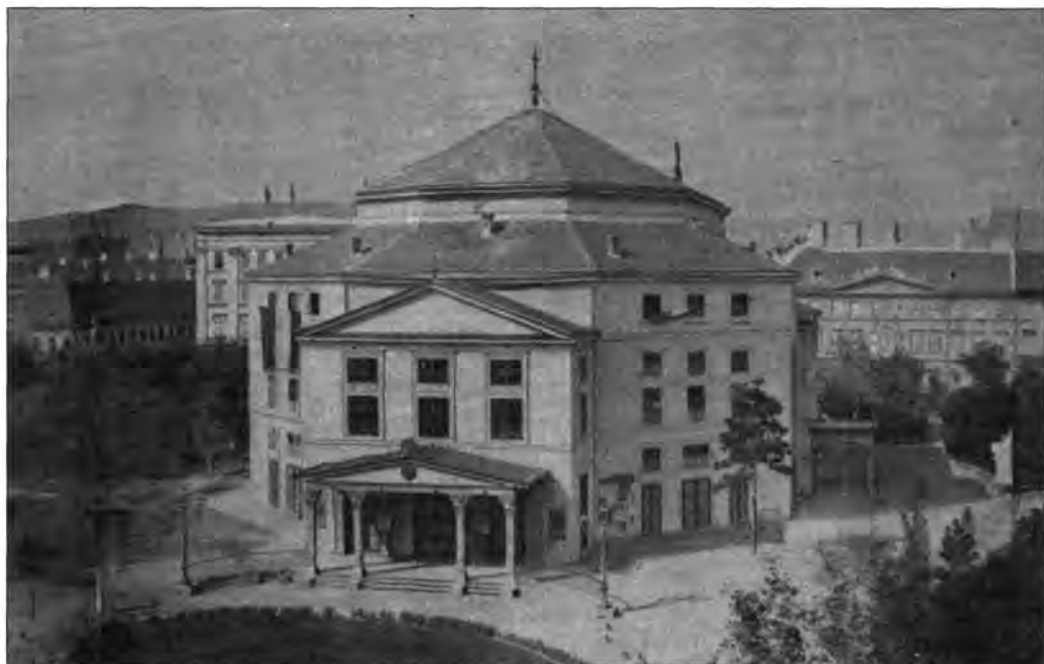
3.5.1 Deutsches Stadttheater (Német Városi Színház) az Erzsébet téren

Németeknek játszó színház több is működik: Budán a régi fészek, a Várszínház és a Horváthkerten az Ofner Tagestheater; Pesten az Erzsébet téri Deutsches Stadttheater (Norththeater) és a Löwölde téren is egy kicsiny játszóhely. Pest-Budán ekkor még csaknem minden második lakos német anyanyelvű. Az 1860-as évek magyar nemzeti törekvései és a kiegyezés kvázi politikai veresége ellenakciókat vált ki: nem adják fel oly könnyen pozícióikat! A hivatalokban még feljűk hűz a bürokrácia, a művészetek még német hatás alatt vannak, aki itt valamire vinni akarja, Bécs