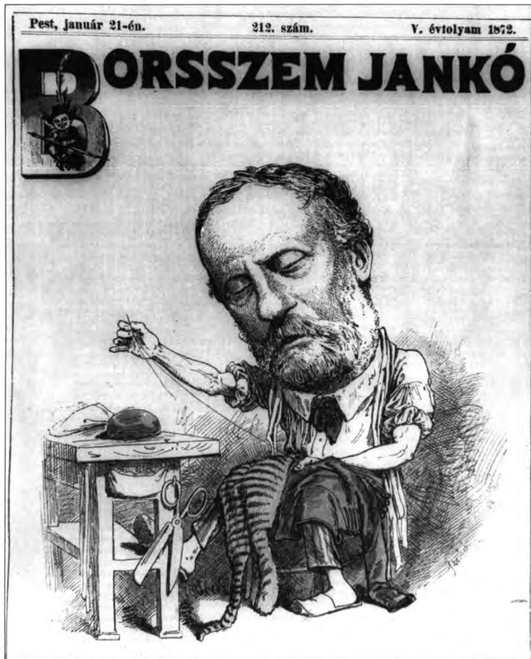
14. kép. (Cím nélkül, Szentkirályi Mór). Borsszem Jankó, 1872. január 21. Címlap

évi absenciájával nem ért el többet, mint hogy ezúttal későn érkezett arra, hogy kötelességét teljesítse.” 24 Az élclapok és karikatúráik nem adtak más képet az 1870 körüli Budapestről, mint amiről a várostörténeti szakirodalom szokott szólni, de más jellegzetességeit domborították ki. Például a heterogén városkép szoros párhuzamba került a lakosság sokszínűségével, és a magyar jelleg inkább még csak a jelszavak szintjén élt. Vagy lényegesen láthatóbban jelen volt a városban