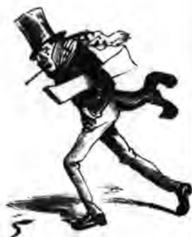
Napidíjazó: Hrr!.. rettenetesen fagy!..