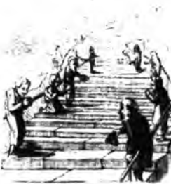
A várba vezető lépcsőzet szobrai.