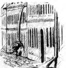
A pesti vízvezeték.