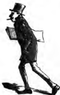
Fogalmazó: Bizony ma hideg van.