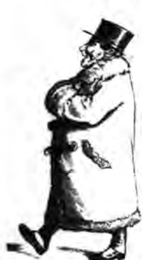
Osztálytanácsos: Jó friss reggel van.