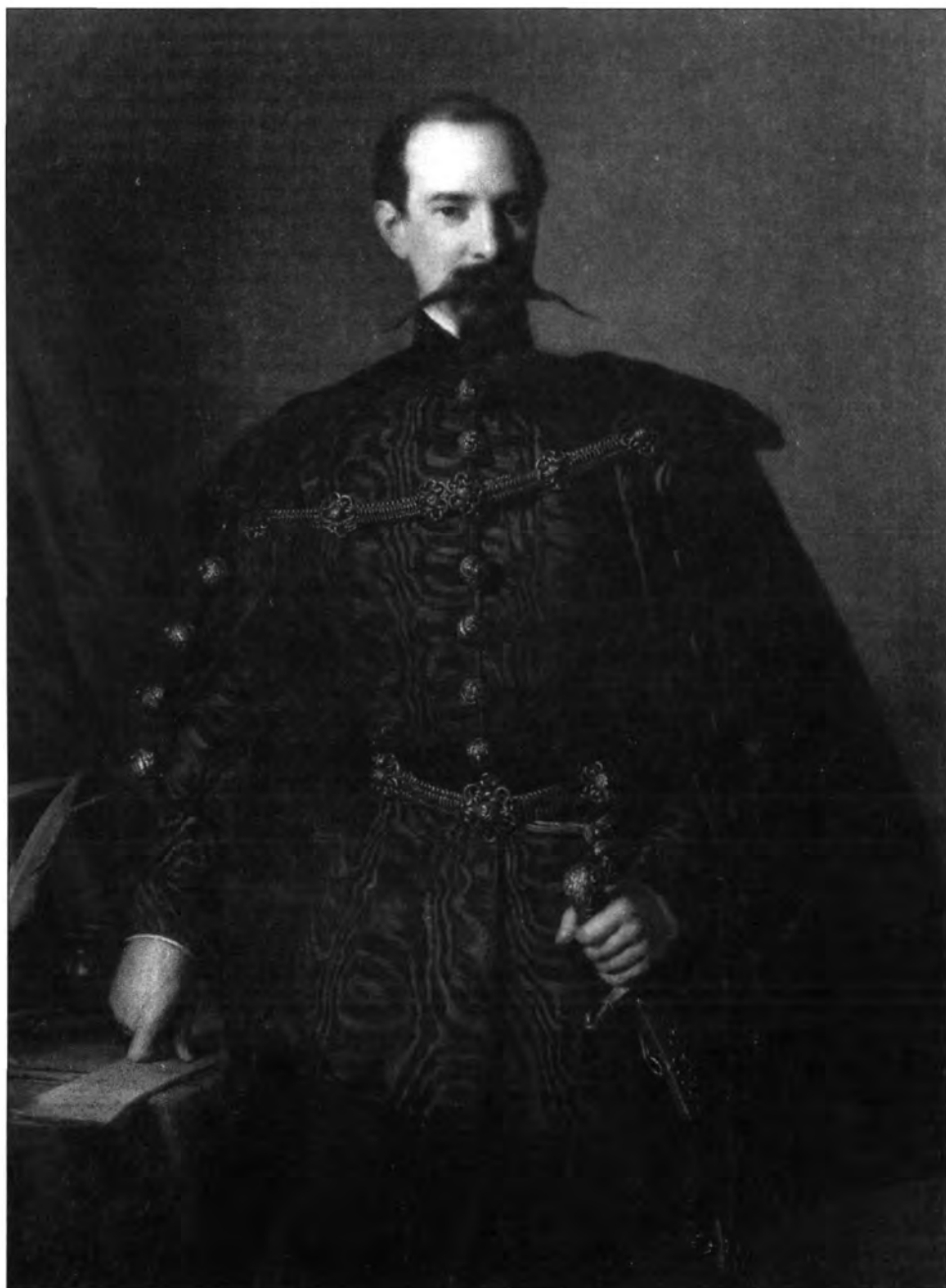
1.4.26. Kovács Mihály: Ráth Károly, 1859

jelvényeik, okleveleik, szociális és spór-szabályaik (ez utóbbi afféle vendéglői „segélypénztár” volt!), használati és emléktárgyaik voltak. A szórakozás, italozás, a fehér asztal gasztronómiai örömei, a vetélkedések, társalgás, politizálás töltötte ki együttlétük idejét. Közben bőven termelt a vicc. A Sasok szívesen anekdotáztak is. S mert férfitársaság volt, alkalmanként pajzánkodtak. Tár-