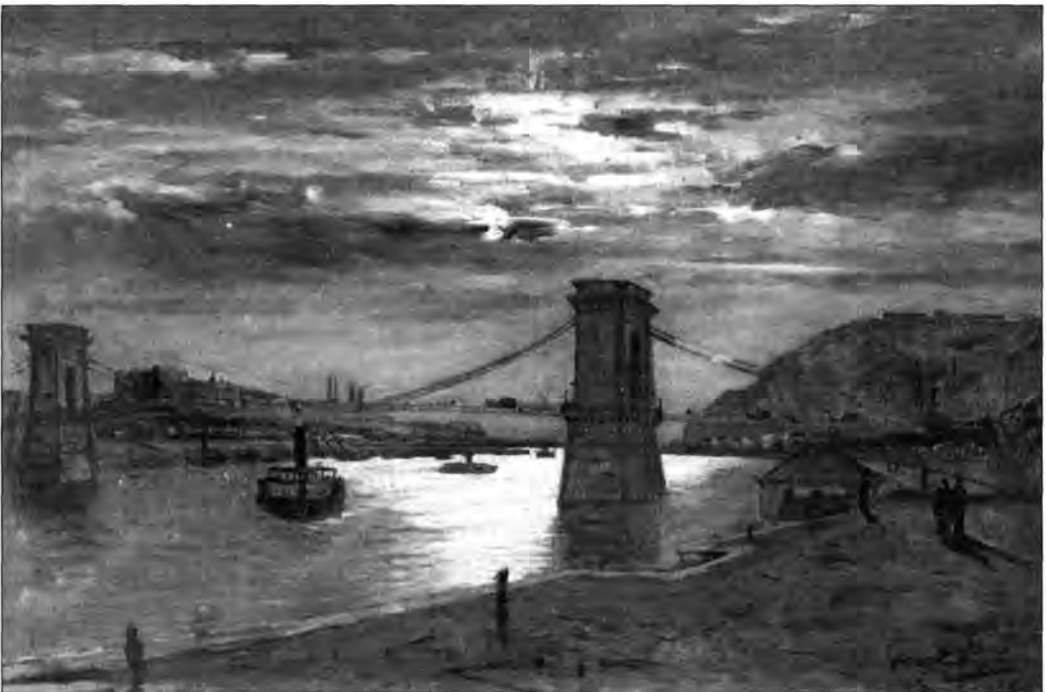
L.5. Feszty Árpád: Lánchíd, 1884

Ez a korszak a kiegyezéssel kezdődött. Ettől a történelmi pillanattól vált megvalósítható lehetőséggé a három – több területen már együttműködő – város törvényi egyesítése. A korszak záróévének pedig a rendezők 1885-öt tekintik. Ebben az évben rendezték meg ugyanis Budapesten az I. Országos Általános ipari kiállítást. A magyar főváros ezzel az első látványos rendezvényével bizonyította, hogy európai értelemben modern ipar- és kultúrvárossá vált.